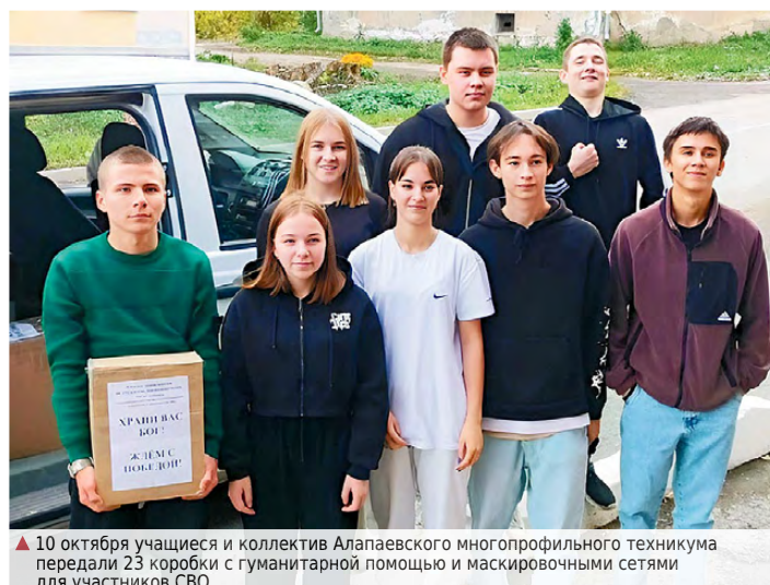
▲ 10 октября учащиеся и коллектив Алапаевского многопрофильного техникума передали 23 коробки с гуманитарной помощью и маскировочными сетями для участников СВО