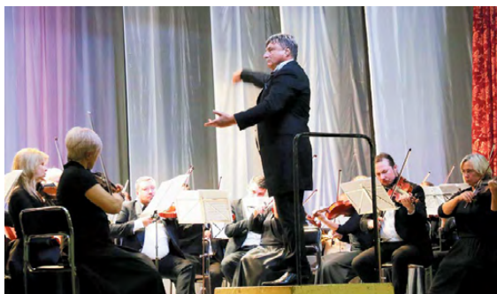
▲ Симфонический оркестр Белгородской государственной филармонии

К таким выражениям позитивных эмоций можно добавить и еще не один десяток – в прошлое воскресенье во Дворце культуры в самой торжественной обстановке открыли новый филармонический сезон.