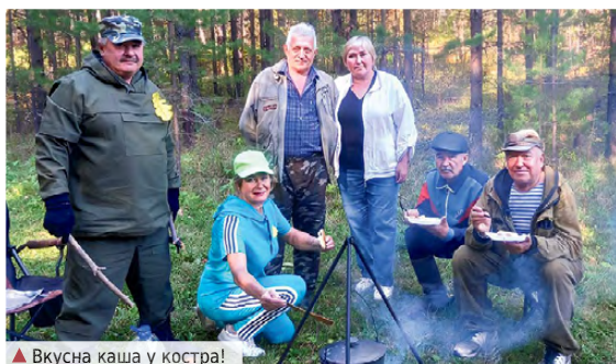
▲ Вкусна каша у костра!

В хороший солнечный день ветераны поселка Западный и ООО «Лестех» провели традиционный туристический слёт.