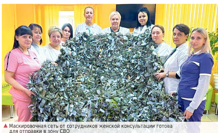
▲ Маскировочная сеть от сотрудников женской консультации готова для отправки в зону СВО