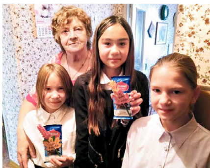
▲ Ученики школы №5 поздравили ветерана