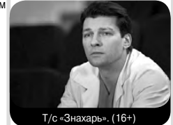
Т/с «Знахарь.» (16+)