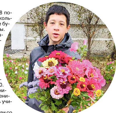
▲ Букеты учителям от учеников школы №8

Подготовила Ольга ВАСИЛЬЕВА