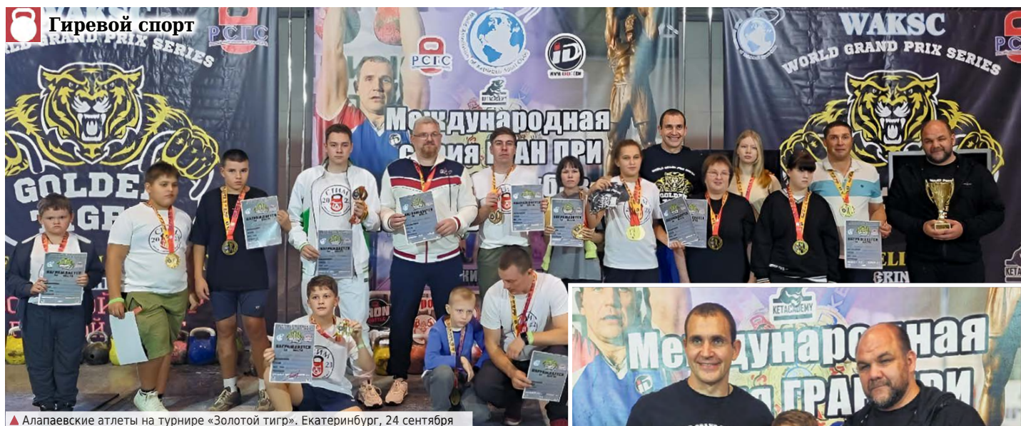
▲ Алапаевские атлеты на турнире «Золотой тигр». Екатеринбург, 24 сентября