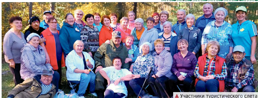
▲ Участники туристического слёта