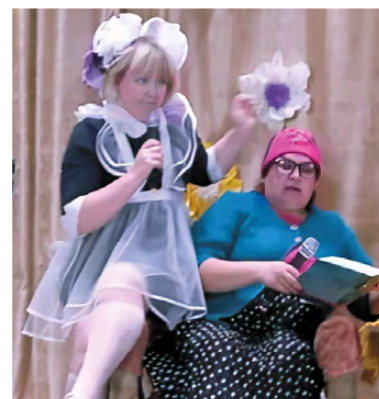
▲ Сценка «Бабушка и внучка»