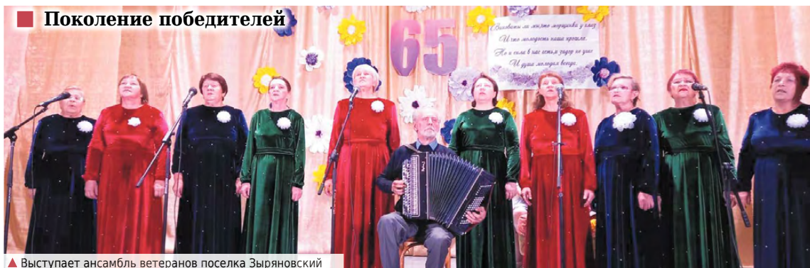
▲ Выступает ансамбль ветеранов поселка Зырянский