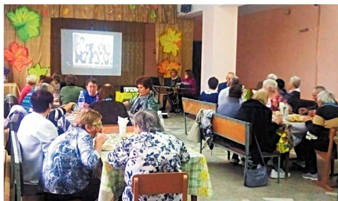
▲ Пьем чай, смотрим фильм