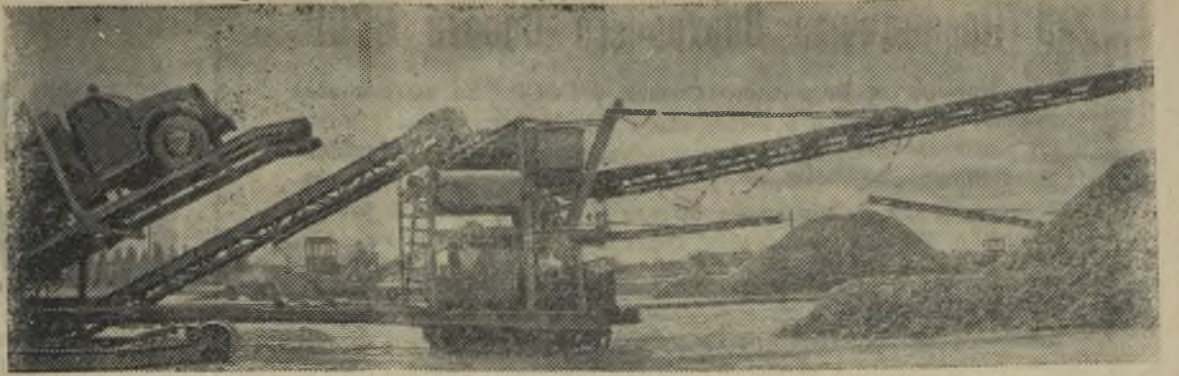
На Полтавщине выращен хороший урожай сахарной свеклы. Многие колхозы собирают по 250—300 центнеров сладких корней с гектара.

Бюро обязало партийные организации стройуправления и предприятий-заказчиков взять ход строительства пусковых объектов под свой контроль.