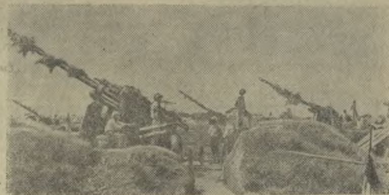
Части противовоздушной обороны сбили над территорией Демократической Республики Вьетнам более 1400 американских стервятников.

На снимке: зенитная батарея в окрестностях Ханоя.