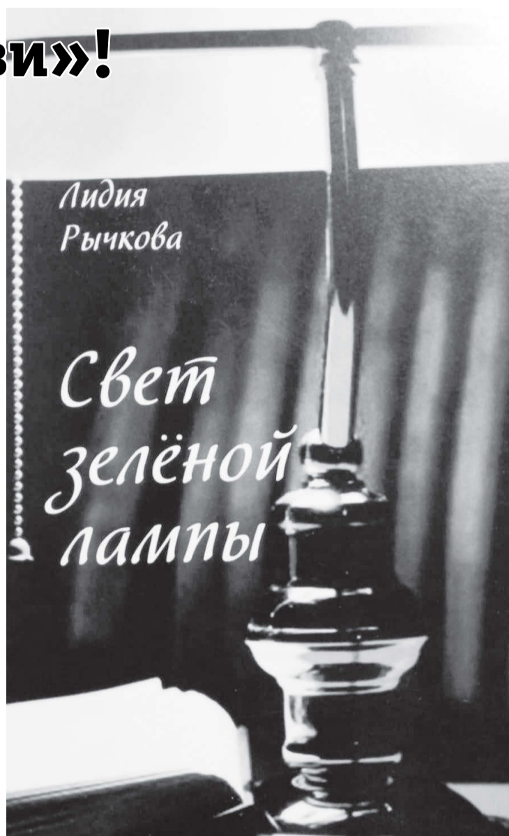
значит, вы живете не зря на Земле!» – таковы заключительные слова сборника стихов Л. Рычковой.