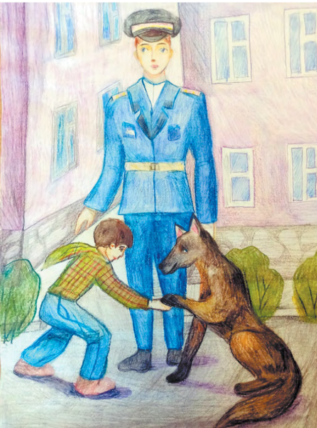
«Хочу стать полицейским», автор Федотов Иван.