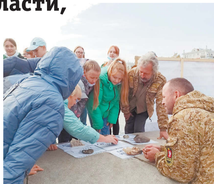
Следопытам пришлось хорошенько подумать, чтобы найти правильные ответы.

логического направления проводили и оценивали представители природоохранных учреждений, в числе которых были сотрудники природно-минералогического заказника «Режевской». Режевляне предоставили участникам образцы ураль-