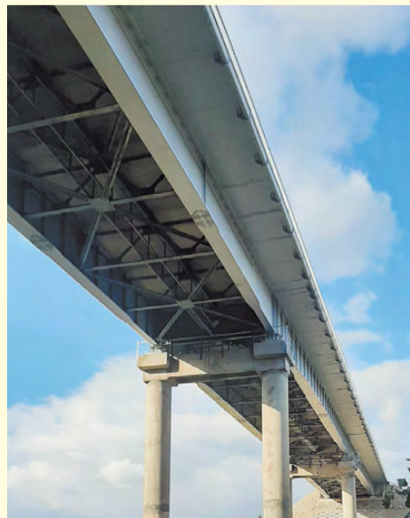
Завершается ремонт моста через реку Реж в районе д. Сохарёво.