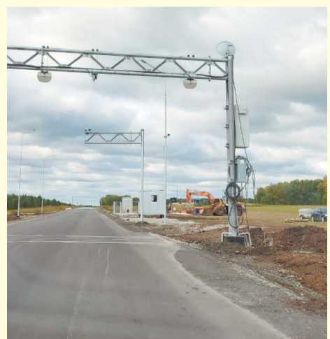
Система весового контроля на автодороге Реж-Невьянск.

Дополнительные средства из федерального бюджета на ремонт, реконструкцию и строительство дорог неоднократно направлялись региону по просьбе Евгения Куйвашева. Глава области уделяет большое внимание поддержке дорожной деятельности. По его словам, строительство новых дорог и своевременный ремонт существующих – важнейший шаг к повышению качества жизни людей.