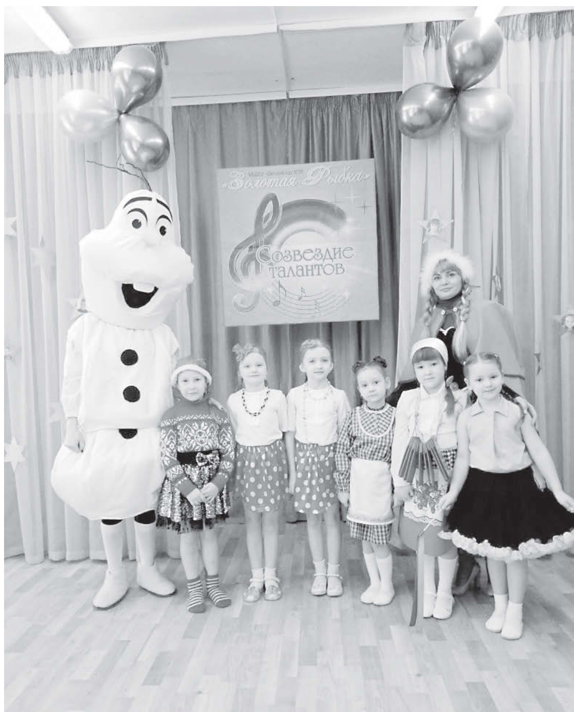
Конкурс «Созвездие талантов» ребятам очень понравился!

В этом году был проведен конкурс художественной самодеятельности «Созвездие талантов» среди воспитанников старшей и подготови-