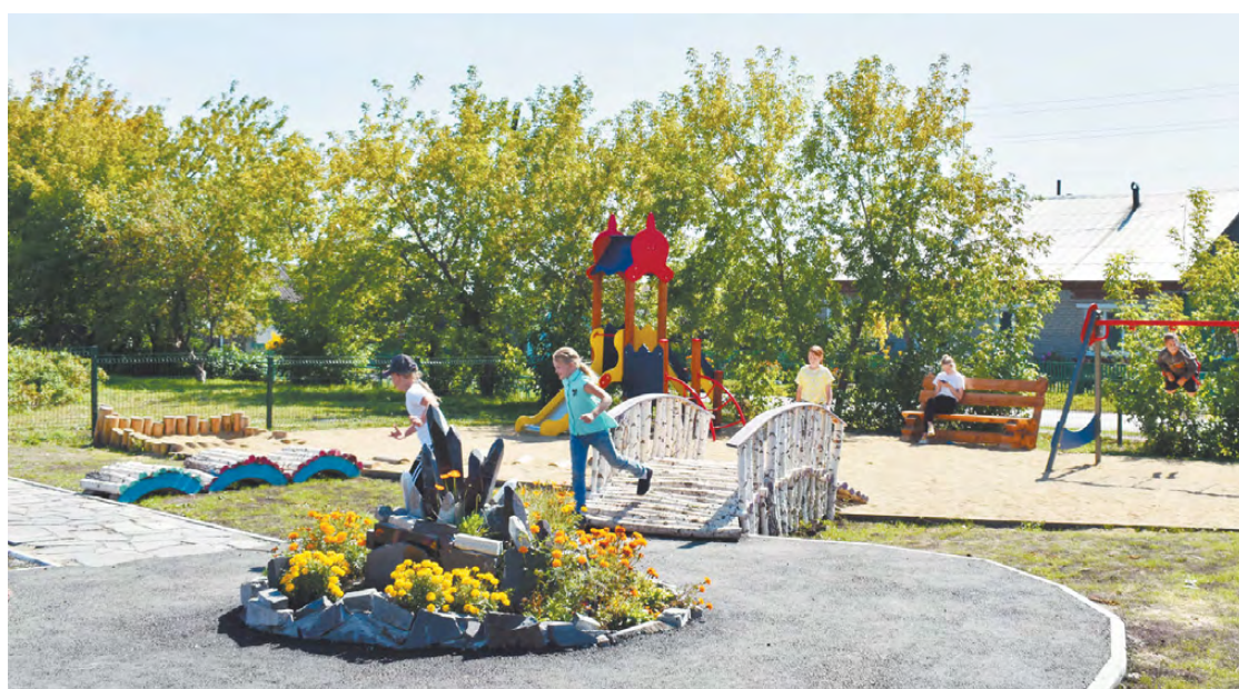
Здесь найдут себе занятие ребята разных возрастов.