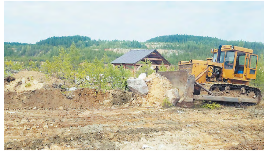
Идёт обустройство территории заказника.

Отметим, благоустройство территории заказника органично вписывается в его живописные места и помогает туристам удобно расположиться, ориентироваться на местности, видеть самые красивые места