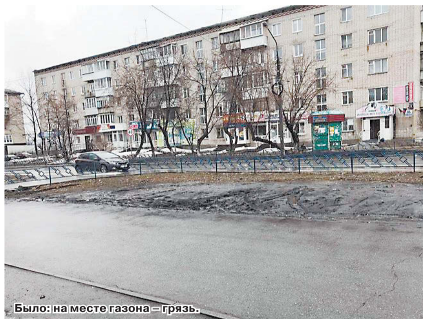
Было: на месте газона – грязь.