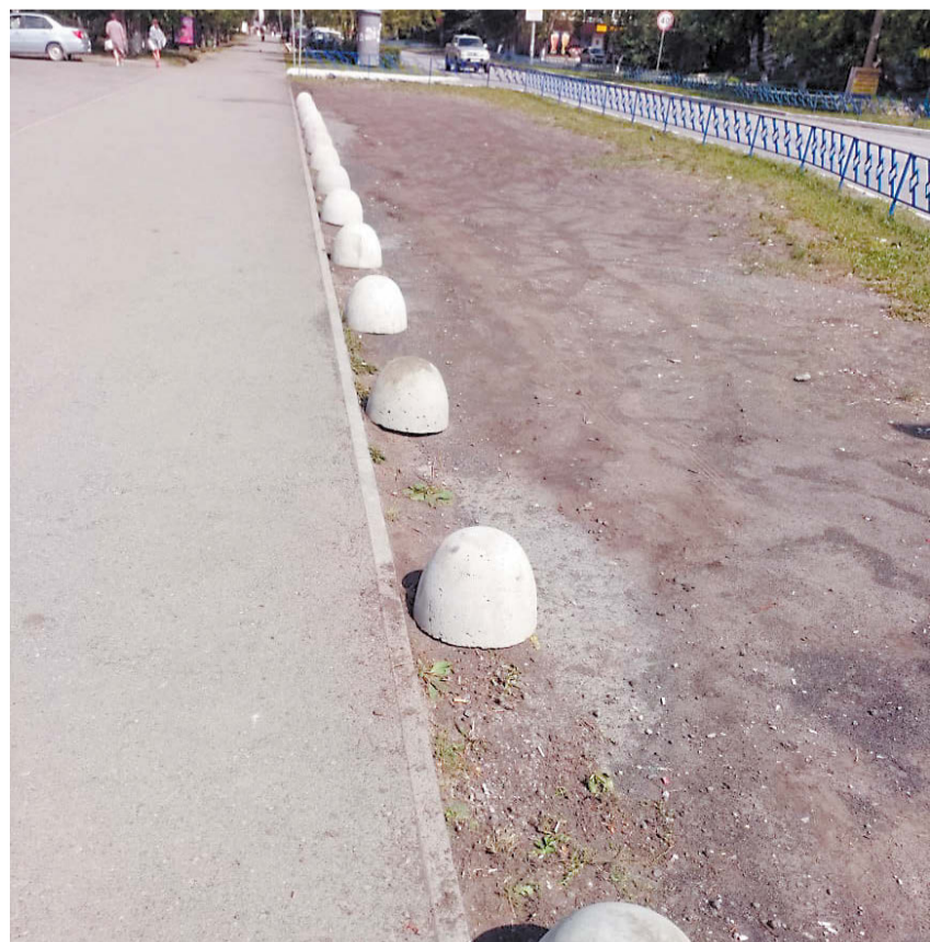
Стало: ограничители покрасят в оранжевый цвет.