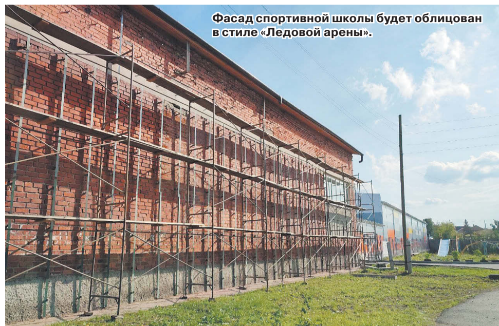
Фасад спортивной школы будет облицован в стиле «Ледовой арены».

В сельских домах культуры также состоялись долгожданные ремонты. Благодаря помощи АО «Сафьяновская медь»