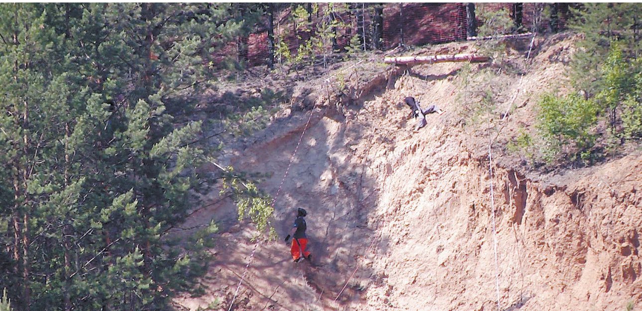
Спасатели штурмуют препятствие.

26 команд, состоявших как из профессионалов, так и из простых добровольцев, преодолевали препятствия: