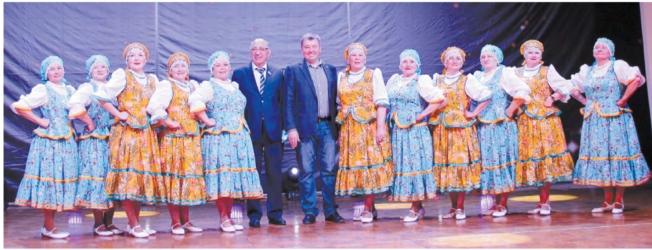
Новые костюмы танцевальный коллектив «Гармония» получил в торжественной обстановке на концерте в ДК «Горизонт».

Помимо этого, коллективы ДК «Горизонт» и Центра на-