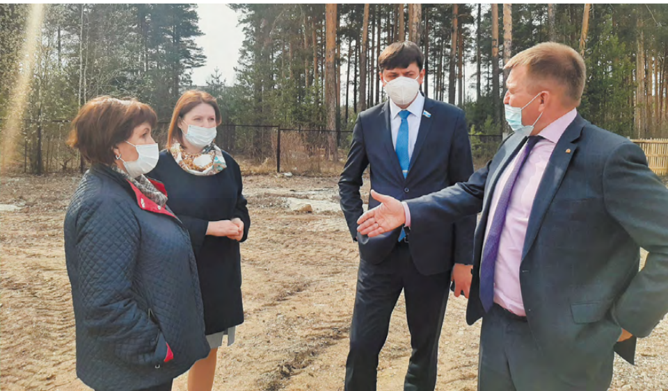
На месте будущую площадку обсудили предметно.