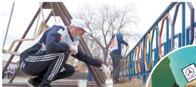
«Сафьяновская медь»: на радость детям, на благо города!