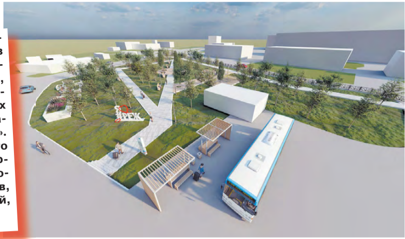
Дизайн-проект сквера у ж/д вокзала №2.

Евгений Куйвашев: «Принципиально важно — и это один из наших приоритетов, — что проекты реализованы и в крупных, и в совсем небольших населенных пунктах, жители которых получили современную инфраструктуру для отдыха и досуга». Также губернатор добавил, что за последние три года в Свердловской области было благоустроено 83 парка, 46 скверов, полсотни улиц, 36 площадей, 470 дворов и 21 набережная.