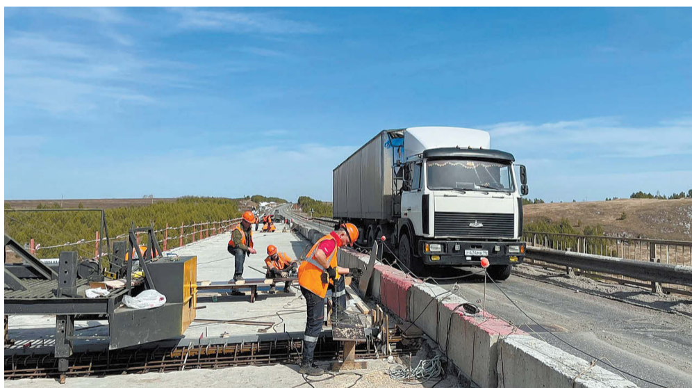
Ремонт моста идёт в рамках нацпроекта «Безопасные и качественные дороги».