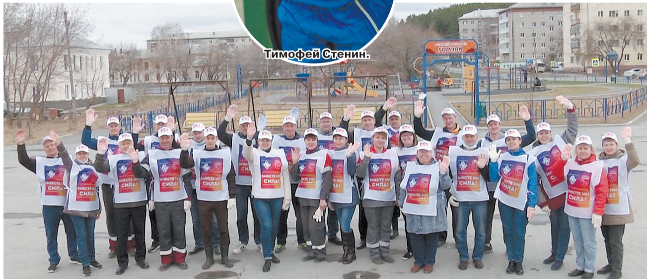
Трудовой десант АО «Сафьяновская медь».