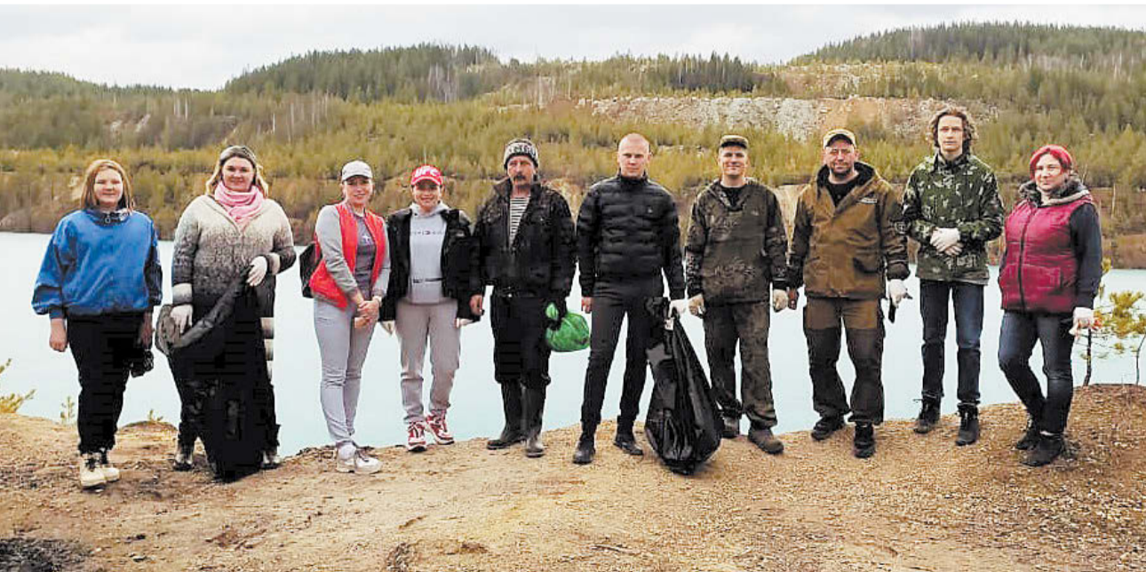
В этом году мусора на карьере было в разы меньше!

Проводить субботники планируют ежемесячно. Если вы желаете принять участие в уборке территории, отслеживайте информацию в группе заказника «Режевской» в социальной сети «ВКонтакте». Там же будут размещены контактные данные, по которым можно связаться с организаторами и записаться на уборку.