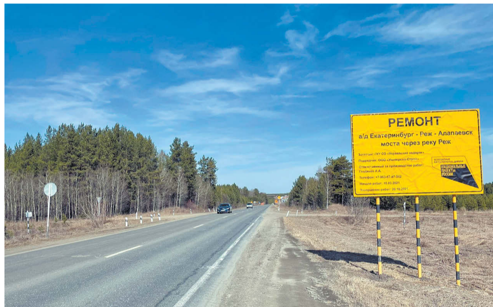
Срок окончания работ – октябрь 2021 года.

По данным департамента информационной политики, ремонтом моста занимается подрядчик ООО «Универсал-Строй». Срок выполнения работ – октябрь 2021 года.