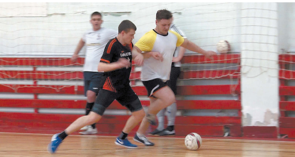
Борьба за мяч в финальном матче «Сафьяновская медь» - «Спарта».