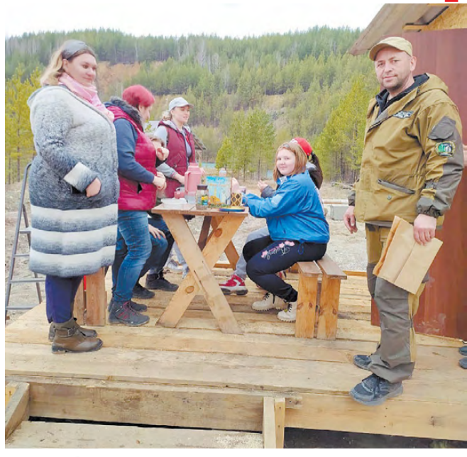
После уборки территории отдыхали: пили кофе, кушали печенье и общались.