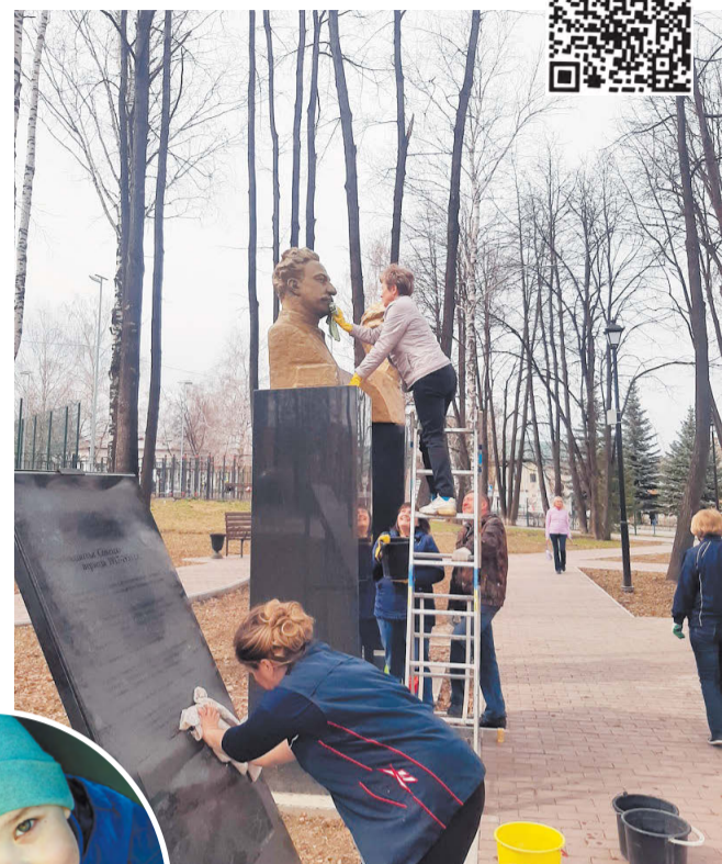
Почистили памятники от грязи и пыли.