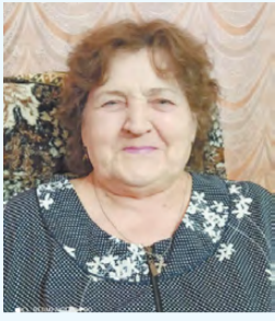
Дети, внуки, правнуки.

Восемь десятков - серьёзная дата, Знак бесконечности жизненных сил. В юность погрузит память обратно, Как каждый день в суете проходил. Мы пожелаем улыбок и счастья, Бодрости духа, желанных вестей, Пусть новый день будет ярким и ясным, Самых счастливых и солнечных дней!