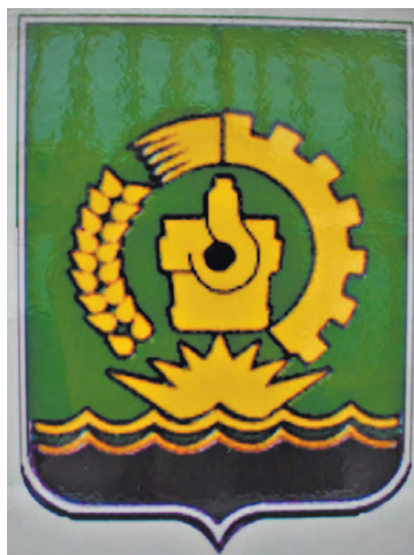
Герб города Режа 1973 года.