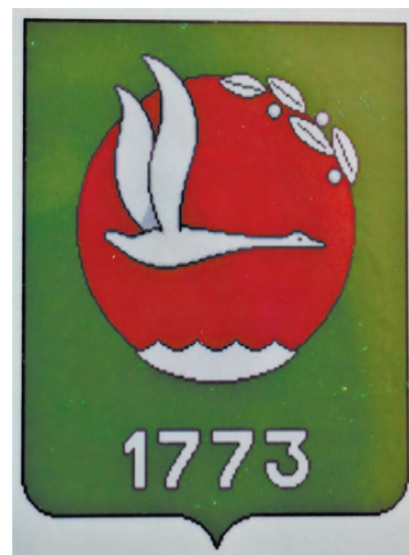
Неофициальный герб Режа 1997 года.