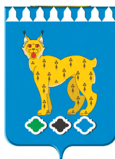
Современный герб РГО.

Старый герб города Режа был выбран по результатам конкурса и был утвержден 10 мая 1973 года решением исполнительного комитета Режевского городского Совета депутатов трудящихся. В центре герба был помещен ковш – символ металлургии. Справа от ковша изображена шестерня, олицетворяющая машиностроение, слева изображен колос – символ сельского хозяйства. Ниже голубым цветом показаны волны, символизирующие реку, от которой пошло название города.