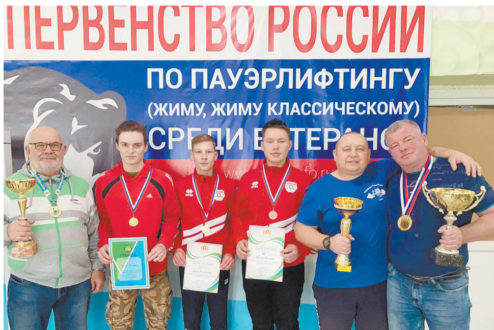
Режевляне заработали более половины победных очков!