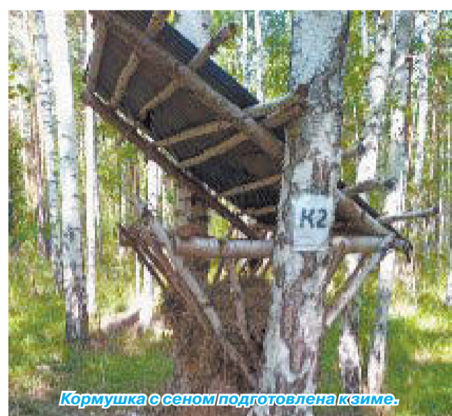
Кормушка с сеном подготовлена к зиме.

Для зимней подкормки лесных животных Режевским обществом охотников заготовлено порядка 20 тонн кормовой зерносмеси, а также 10 тонн сена и около 5 тонн кормовой соли. Подкормка рассчитана на копытных животных, но кормушками охотно пользуются и другие обитатели леса.