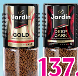
Кофе Жардин Голд, Дип Дарк 95 гр. 137.50