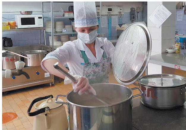
Поварам, конечно, пришлось потрудиться.