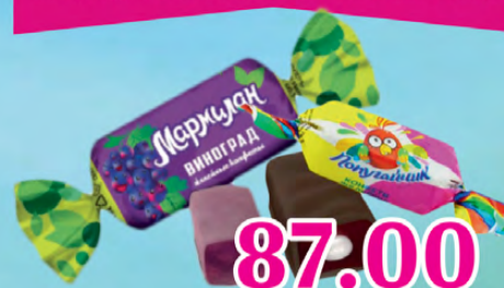
Конфеты желейные 1 кг 87.00