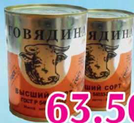
Говядина тушеная Салют ГОСТ 338 г 63.50