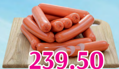
Сосиски Молочные вязанка 1 кг 239.50

с 31.03 по 14.04 Акция действительна при наличии товара