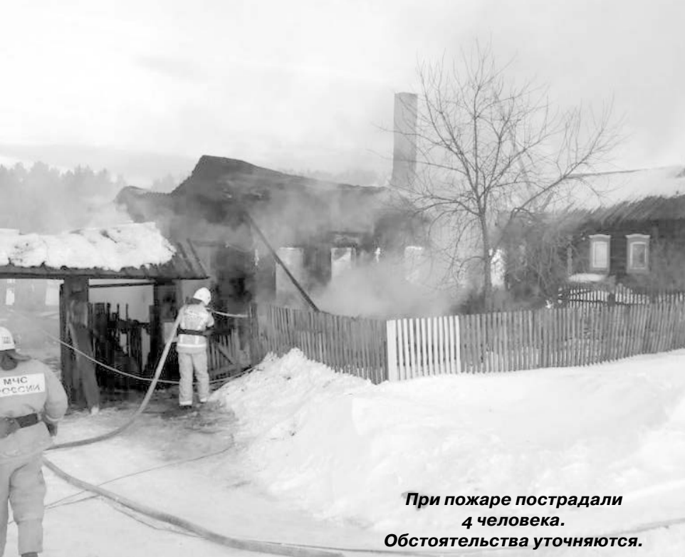
При пожаре пострадали 4 человека. Обстоятельства уточняются.