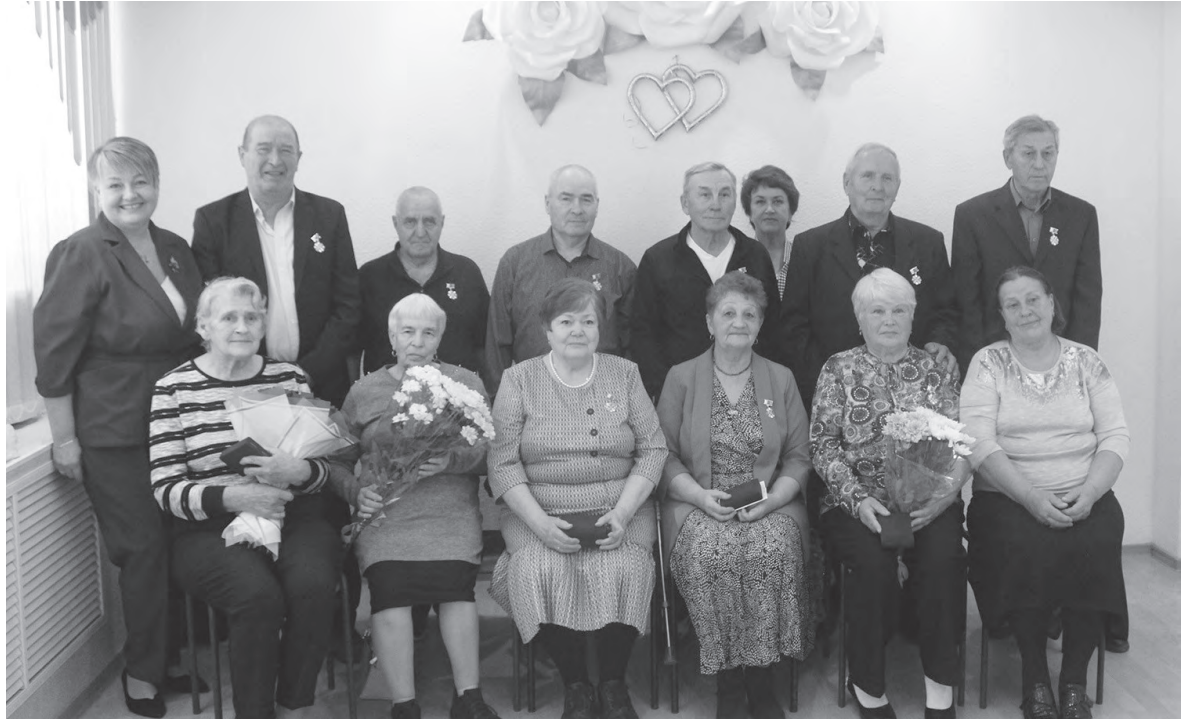
«Золотые» пары Красноуральска