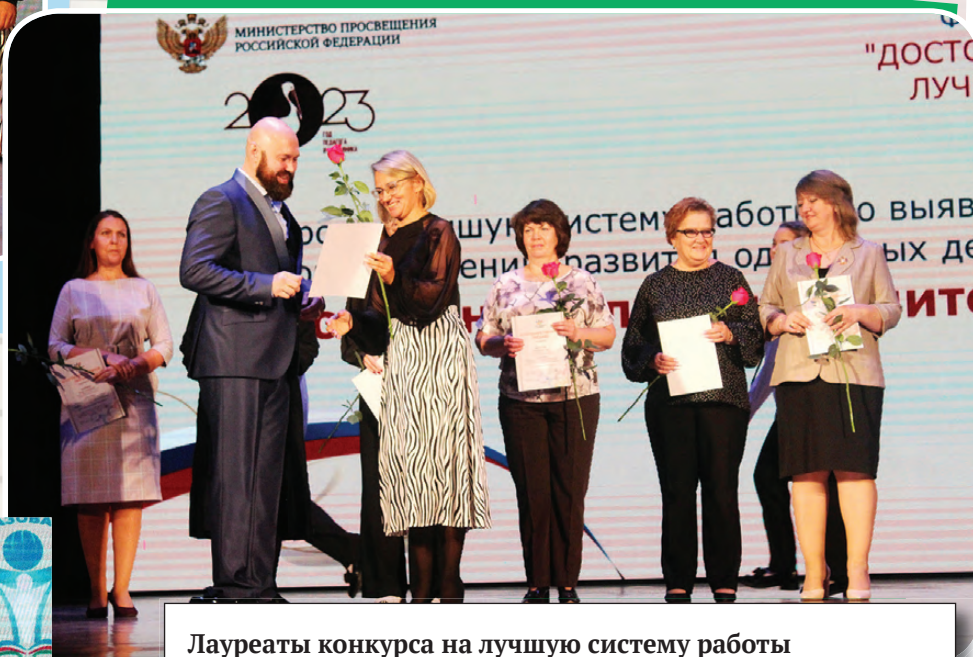
Лауреаты конкурса на лучшую систему работы по выявлению и сопровождению развития одаренных детей «Достойным – лучший учитель»