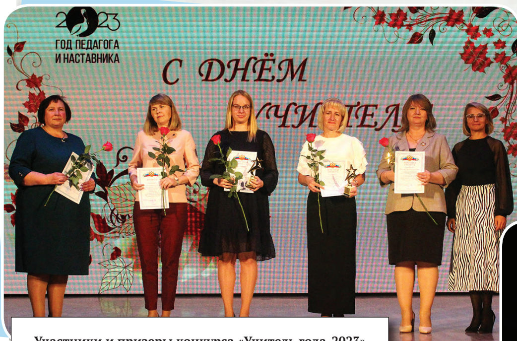
Участники и призеры конкурса «Учитель года-2023»