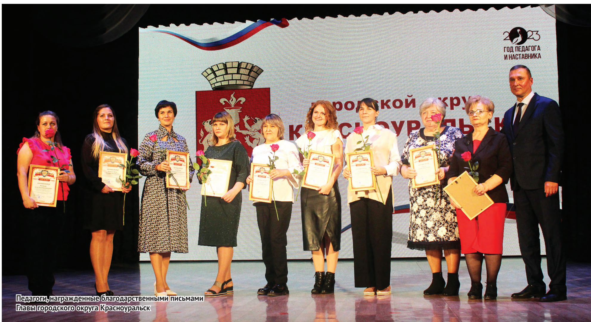
Педагоги, награжденные благодарственными письмами Главы городского округа Красноуральск