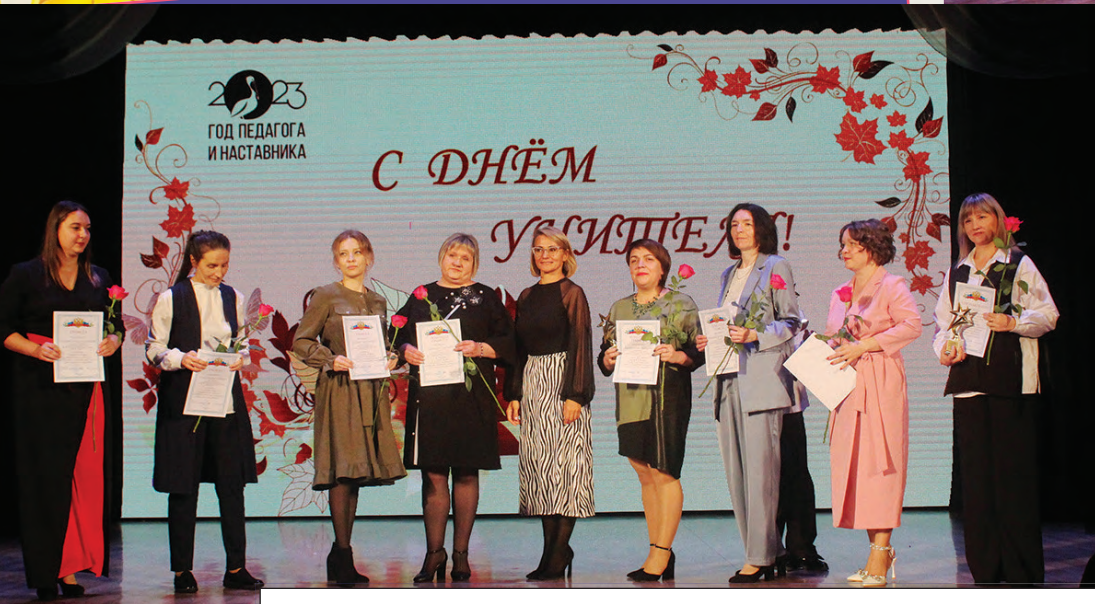
Участники и победители конкурса образовательных программ по развитию способностей обучающихся в дополнительном образовании