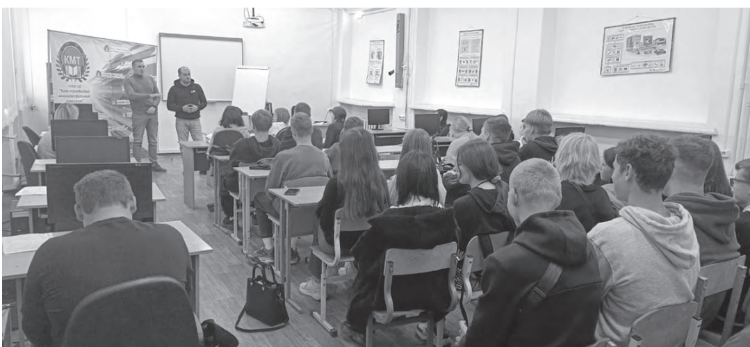
Встреча с лидерами национально-культурных организаций Свердловской области