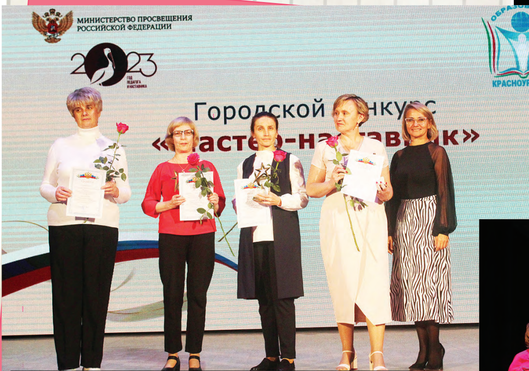
Участники и призеры конкурса «Мастер-наставник»