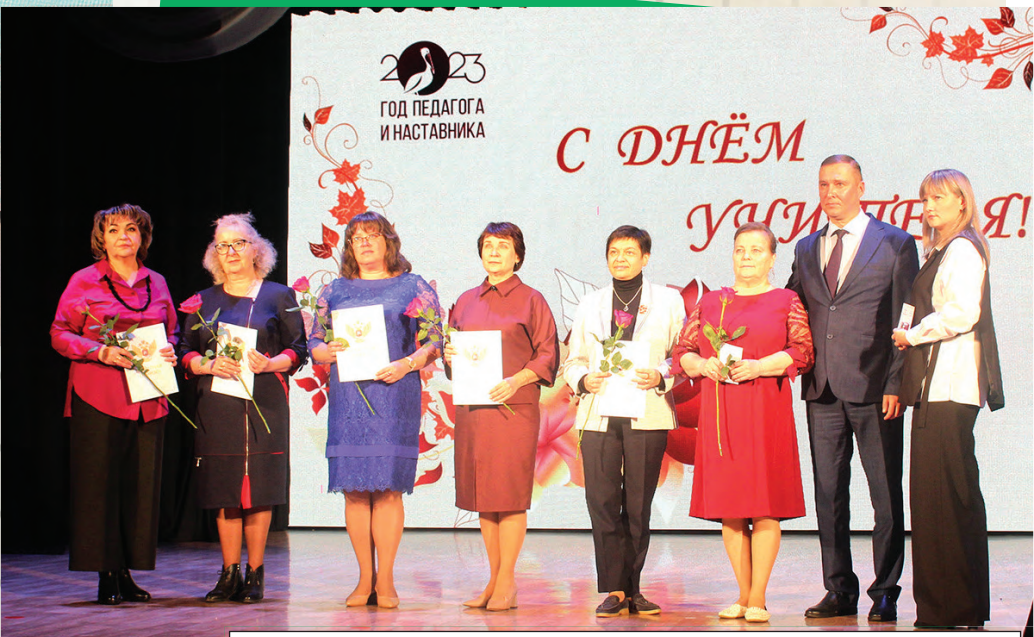
Педагоги, удостоенные почетных грамот Министерства просвещения РФ