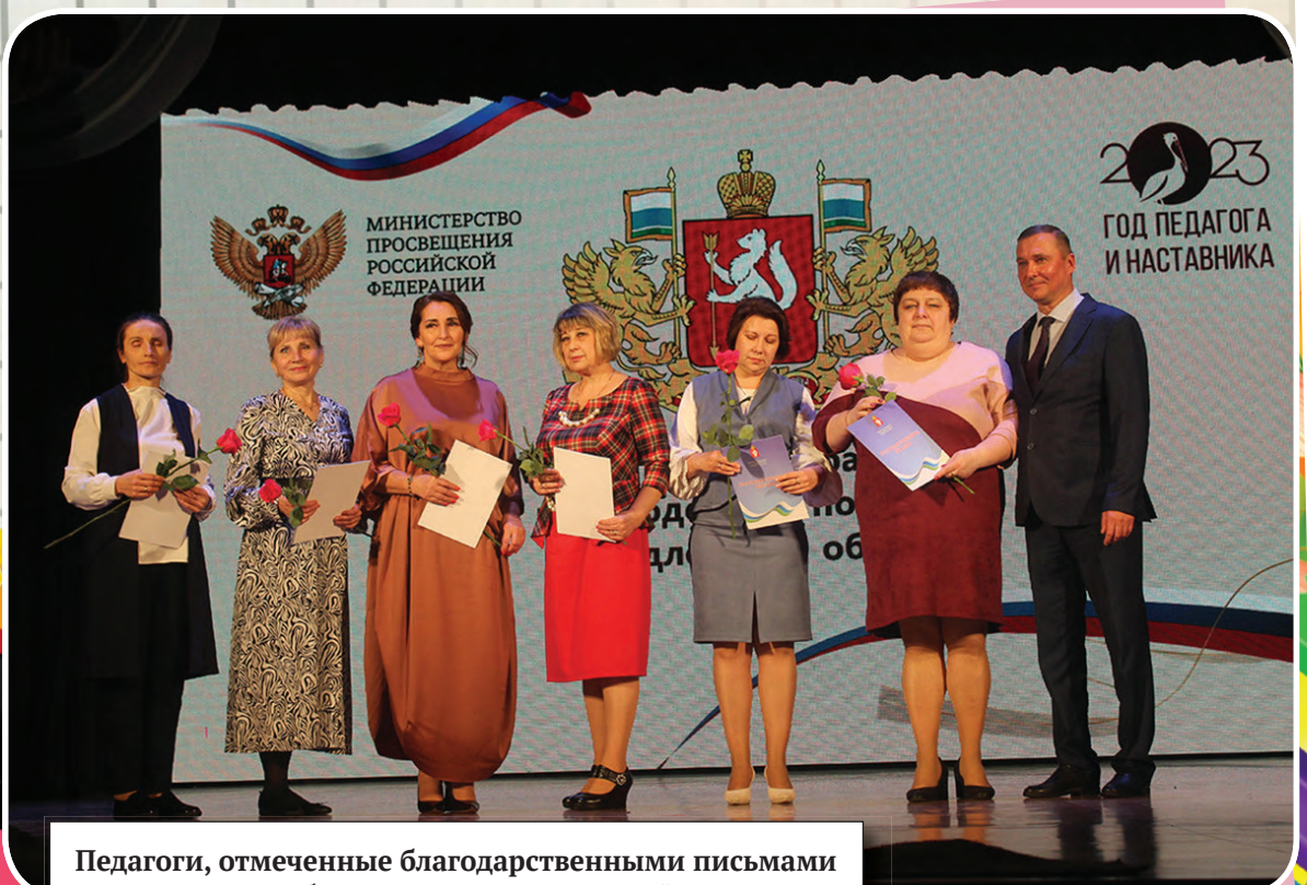
Педагоги, отмеченные благодарственными письмами Министерства образования и молодежной политики Свердловской области