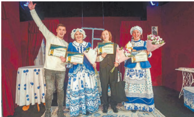
Елена АБРАМОВА.