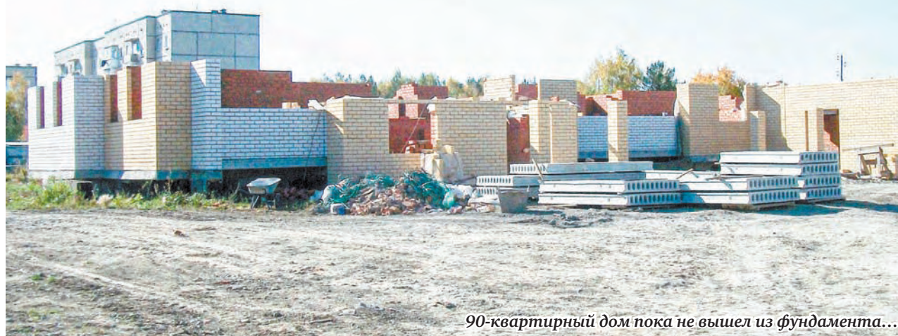
90-квартирный дом пока не вышел из фундамента...

Поднявшийся было со второй половины августа с фундамента 50-квартирный дом по улице Маршала Жукова, 15 со второй половины сентября перешёл на «тихий ход». У генподрядчика – ООО «СУ-5 Групп» из Екатеринбурга – вновь финансовые и кадровые проблемы.