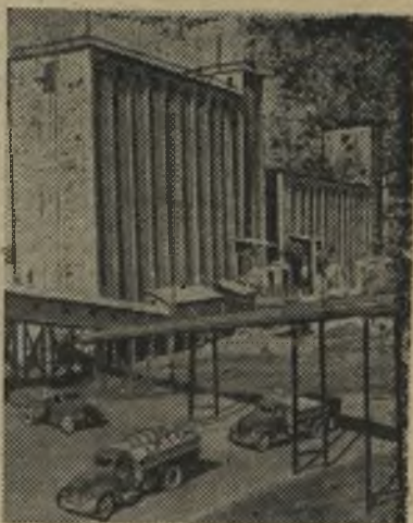
Зерно нового урожая широким потоком идет на хлебоприемные пункты Удмуртии. Сотни тонн зерна поступили на Можгинский элеватор (на снимке).