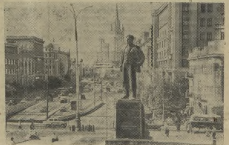
Москва сегодня. Площадь Маяковского.