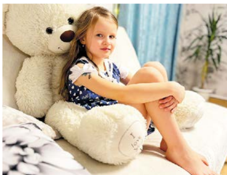
▲ Маша – творчески одарённая натура