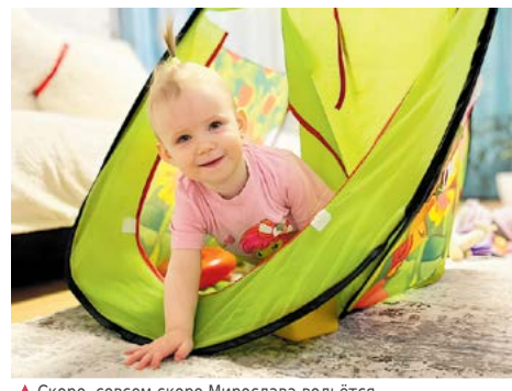
▲ Скоро, совсем скоро Мирослава вольётся в свой первый детский коллектив