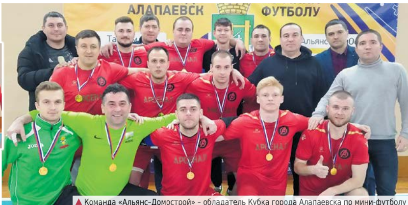
▲ Команда «Альянс-Домострой» – обладатель Кубка города Алапаевска по мини-футболу