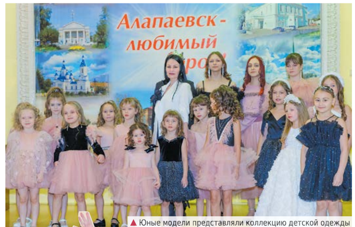
▲ Юные модели представляли коллекцию детской одежды