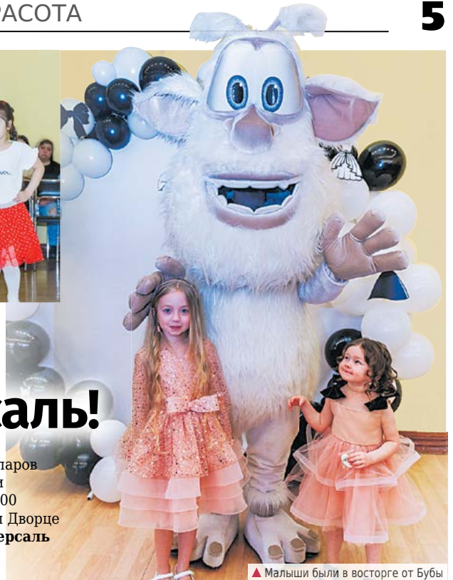
▲ Малыши были в восторге от Бубы

Подготовила Ольга СИМОНОВА