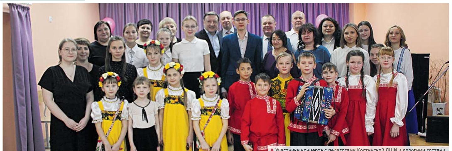
▲ Участники концерта с педагогами Костинской ДШИ и дорогими гостями