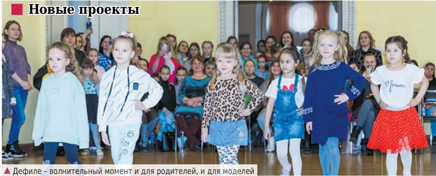
▲ Дефиле – волнительный момент и для родителей, и для моделей