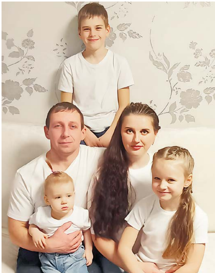
▲ Вот он – портрет тихого семейного счастья

женщина влюблена, ей трудно оценивать ситуацию трезво.