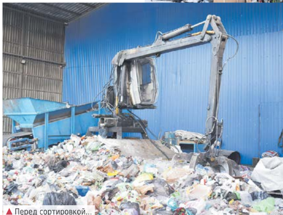
▲ Перед сортировкой...

Споры по работе нового мусоросортировочного комплекса в Алапаевске не утихают с начала его эксплуатации. В 2019 году между администрацией города и ООО «Экотехнопарк» был заключен договор на аренду участка с дальнейшим строительством и производством на нем межмуниципального центра по обращению с бытовыми отходами. Сейчас здесь работает линия по сортировке отходов 4-го и 5-го классов опасности. К 4-му классу относятся дорожный и уличный мусор, а также строительные отходы. 5-й класс – пищевые остатки и отходы органического происхождения, не требующие специальных условий по обращению и не представляющие угрозы для природы и человека. Классификация ТКО указана на мусоровозах ЕМУП «Спецавтобаза», осуществляющего обращение с отходами на территории Алапаевска. Еженедельно (2-3 раза в неделю) специалисты областного регионального оператора на алапаевской площадке по сортировке отходов проводят проверку цикличности переработки и складированные объемы «хвостов».