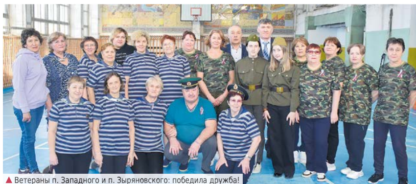
▲ Ветераны п. Западного и п. Зыряновского: победила дружба!