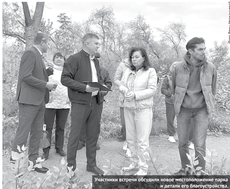
Участники встречи обсудили новое местоположение парка и детали его благоустройства.

На территории парка мясокомбината состоялась встреча представителей администрации ГО Богданович и депутатов Думы с жителями северной части города, которые принимают активное участие в проекте инициативного бюджетирования по приведению в порядок этой общественной территории