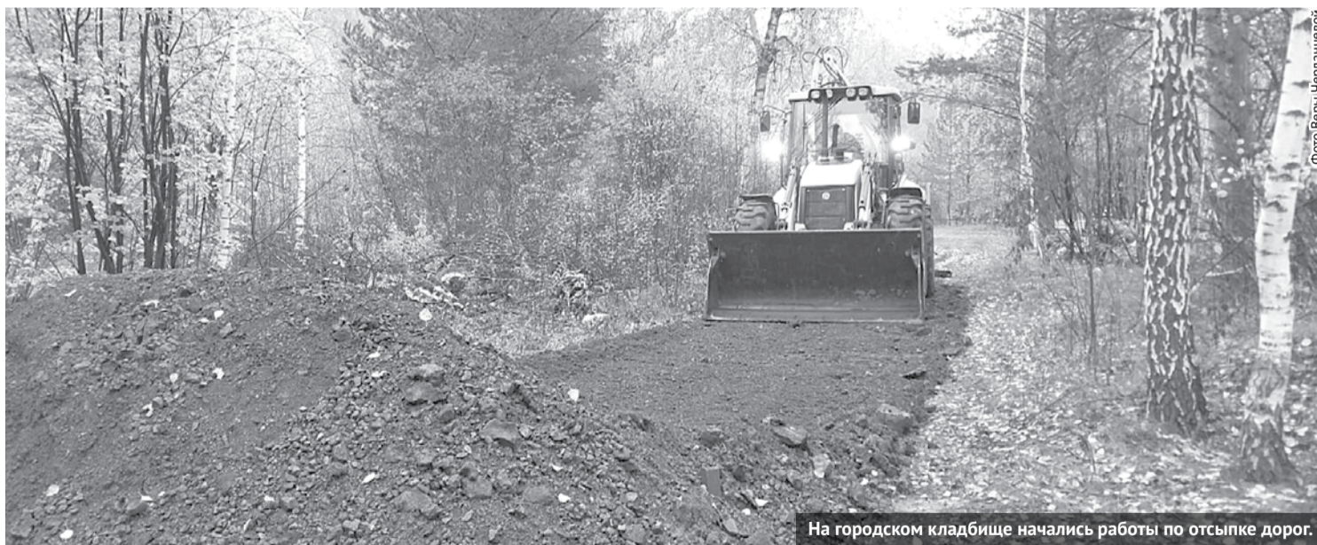
На городском кладбище начались работы по отсыпке дорог.