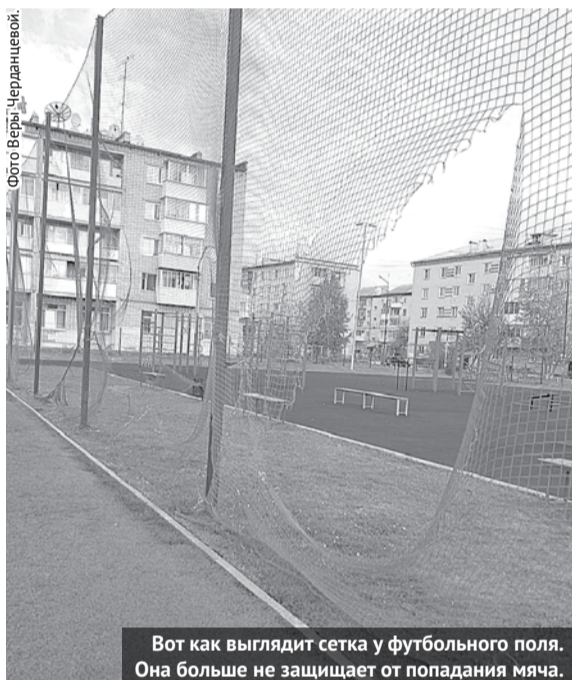
Вот как выглядит сетка у футбольного поля. Она больше не защищает от попадания мяча.

С 6 часов до 7:30 - занятия спортом по предварительным заявкам. С 7:30 до 8 часов - технологический перерыв. С 8 до 15 часов - учебные занятия обучающихся школы №5. С 15 до 19 часов - внеурочные занятия (кружки, секции, тренировки) и занятия ДЮСШ по согласию. С 19 до 21 часа - занятия спортом по предварительным заявкам.