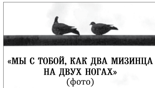
«МЫ С ТОБОЙ, КАК ДВА МИЗИНЦА НА ДВУХ НОГАХ» (фото)