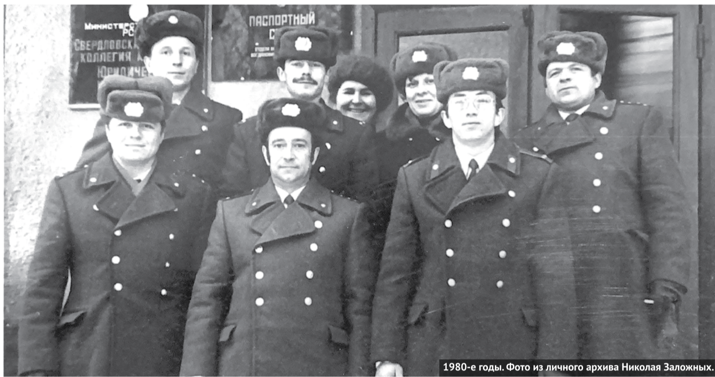
1980-е годы.

УГРО – эта аббревиатура известна многим. Менялись названия и структура ведомства. Но неизменными оставались задачи: найти и обезвредить. 5 октября 2023 года сотрудники уголовного розыска МВД РФ отмечают 105-ю годовщину образования службы. Как жил и живет сейчас отдел уголовного розыска ОМВД России по Богдановичскому району, читайте в материале