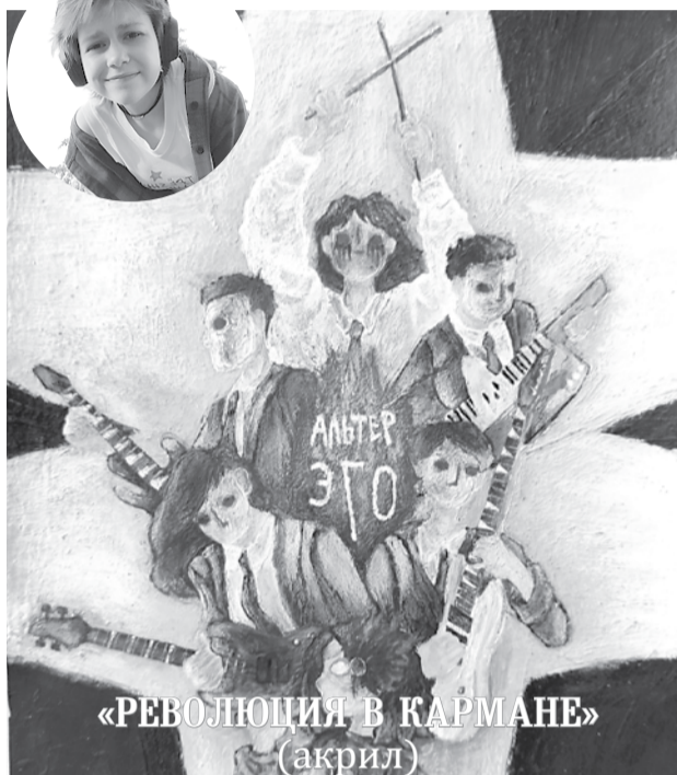
«РЕВОЛЮЦИЯ В КАРМАНЕ» (акрил)