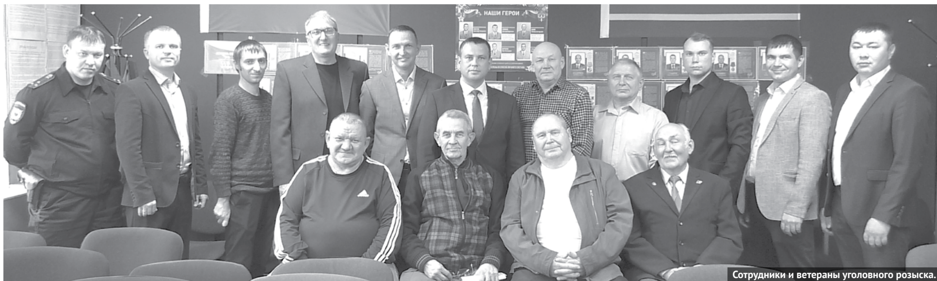
Сотрудники и ветераны уголовного розыска.

Погони, перестрелки, засады, встречи с преступником один на один... Ко всему этому сотрудник уголовного розыска должен быть готов ежедневно, ежечасно. Уголовный розыск – одно из наиболее крупных и важных подразделений МВД. Именно его сотрудники всегда были и остаются на передовой борьбы с преступностью, а в самых сложных ситуациях с риском для жизни проявляют выдержку, самообладание и самоотверженность. Вот что значит – работать и мыслить оперативно.