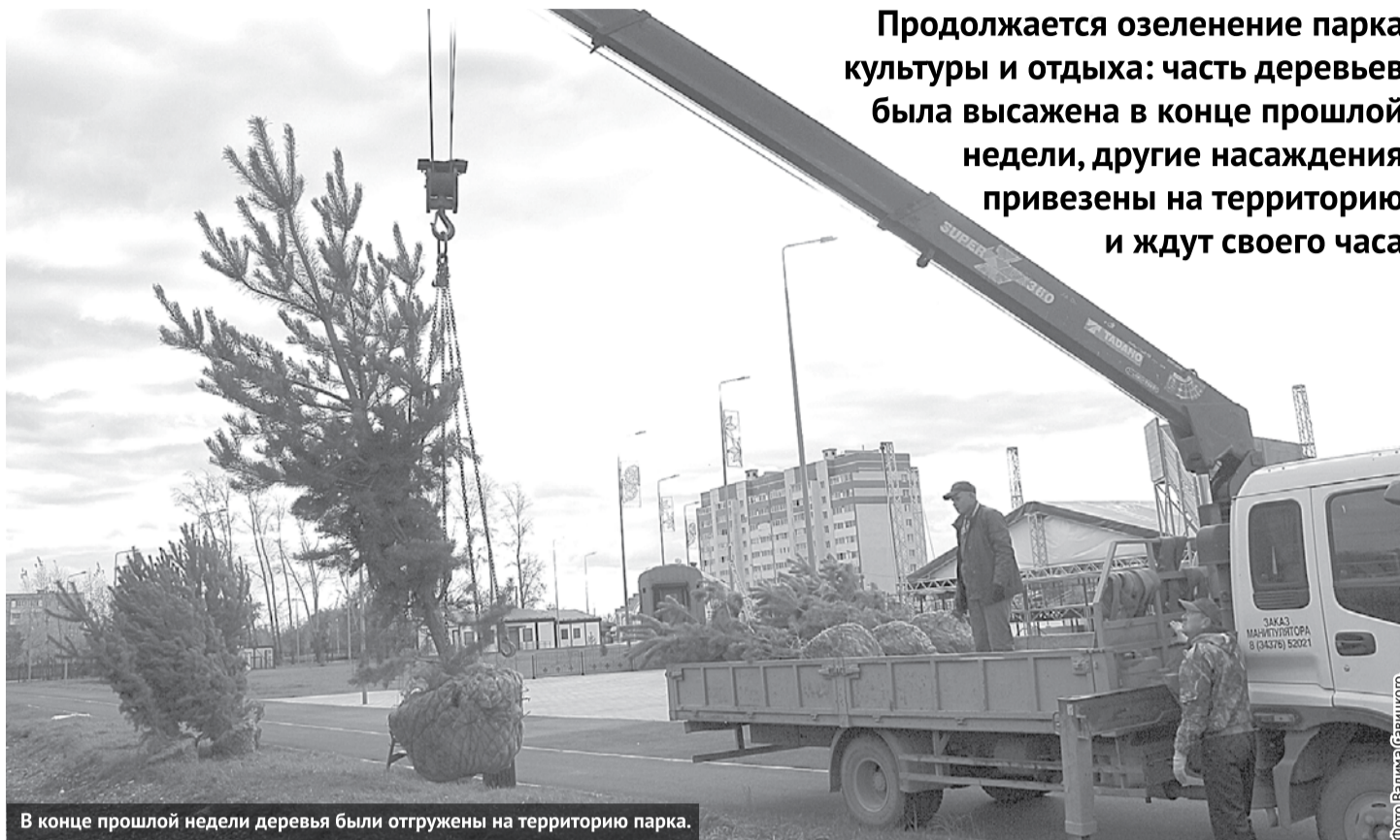
В конце прошлой недели деревья были отгружены на территорию парка.

И, наконец, в конце минувшей недели работники парка культуры и отдыха начали высаживать 35 сосен на территории около линии гаражей и девять берез вдоль забора у улицы Первомайской. Работы еще не окончены.