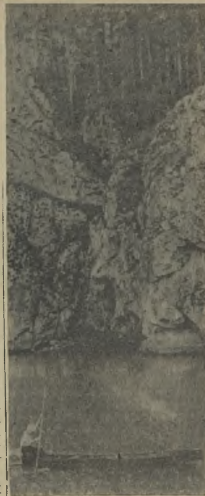
НА РЕКЕ РЕЖ.

В комнате-музее В. Ленина хранятся 38 писем старейших коммунистов, хорошо знавших или видевших нашего вожда.