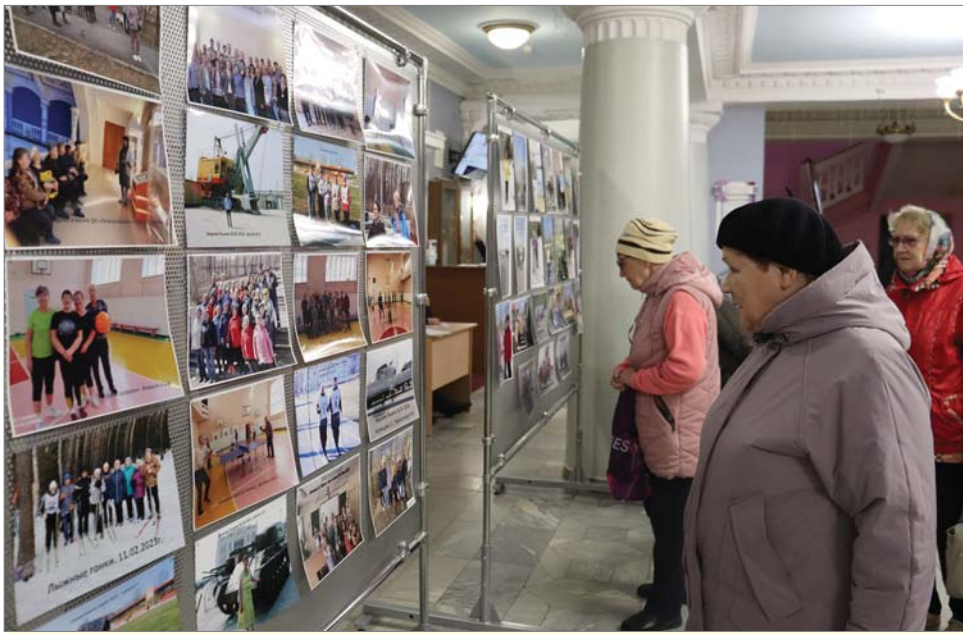
Мимо фотовыставки никто не проходил.

люди серебряного возраста принимают поздравления.