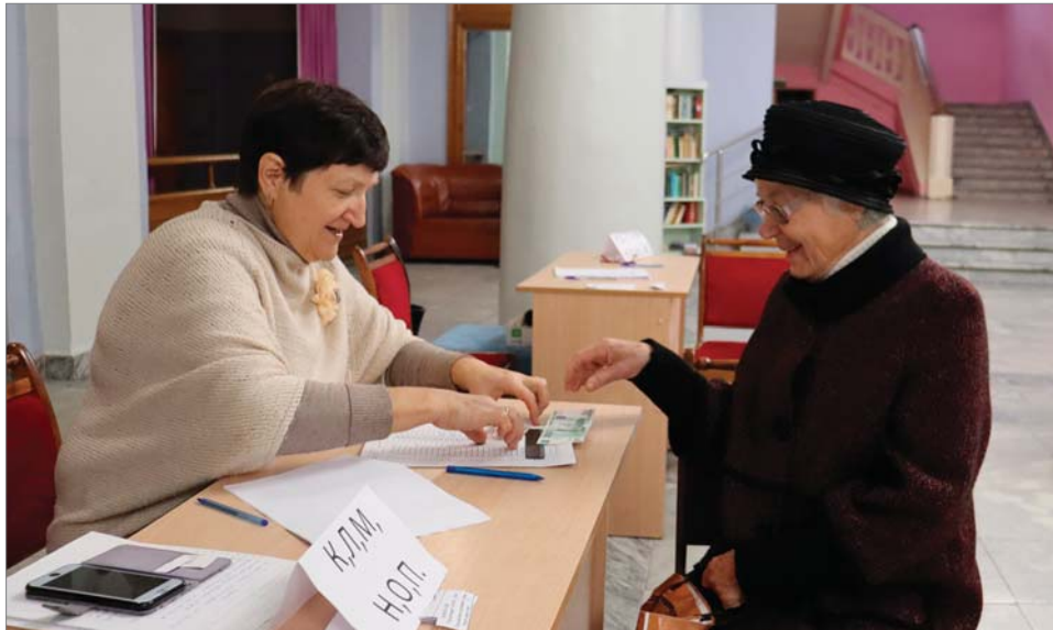
Во Дворец – за заводской премией.