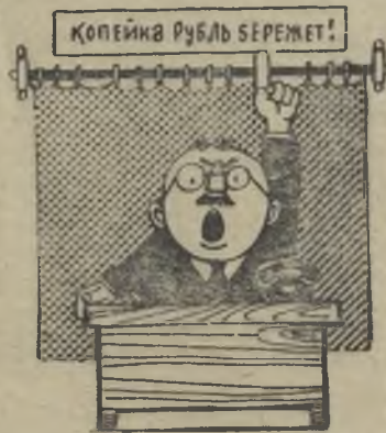
Шумел, шумел, махал руками, Но разошлись слова с делами.