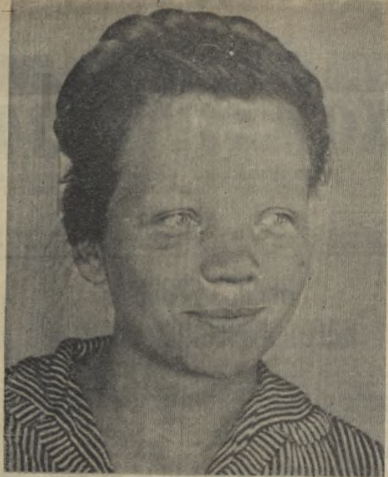
10 августа в Москве в Большом Кремлевском дворце открылся VII съезд уполномоченных потребительской кооперации СССР.

На съезд избрано 1799 делегатов. Приглашены иностранные гости — представители зарубежных кооперативных организаций.