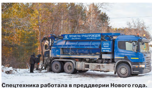
Спецтехника работала в преддверии Нового года.

Нередки случаи, когда жильцы многоквартирных домов жалуются на засоры в канализационных колодцах. По мере поступления обращений их расчищают, однако не всегда имеющихся ресурсов хватает на устранение аварийных ситуаций, и происходят более серьезные случаи, связанные с подтоплением близ расположенных территорий.