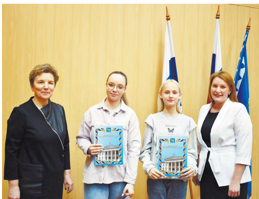
Награждение победителей конкурса.

Администрация РГО выражает благодарность всем педагогам, сотрудникам и учителям ГАПОУ СО «Режевской политехникум», школ № 4, № 5, № 10 за активную помощь в привлечении учащихся и студентов к участию в городском конкурсе социальной рекламы «Мы против коррупции» в рамках антикоррупционного просвещения и профилактики коррупционных проявлений.