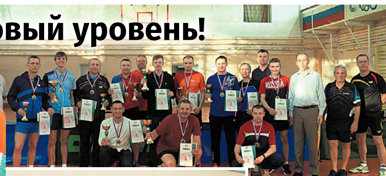
▲ Призеры и победители турнира