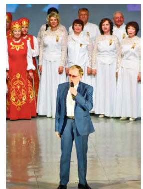
▲ Иван Пермяков, народный артист России