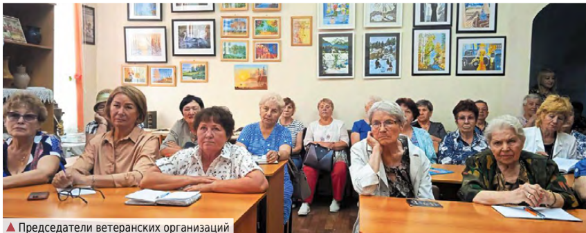
▲ Председатели ветеранских организаций

жественные страны, руководствуясь опытом распада СССР, уверены, что Россия вскоре расколется. Они не учитывают, что сейчас ситуация совершенно другая. Большую роль играет фактор цивилизационной идентичности. Она объединяет соотечественников, которых связывают не столько паспорта граждан России, сколько совместное прошлое, традиции и культура. Люди понимают, что наша страна — это не просто суверенное государство, это особая цивилизация, несущая в себе элементы и Запада, и Востока.