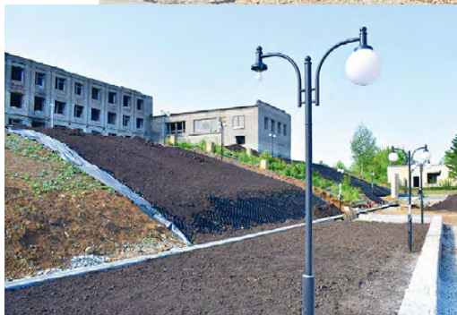
▲ На незавершенном объекте уже разбит стеклянный плафон

рени и плакучей ивы. Комплекс работ по выполнению второго этапа благоустройства ново-