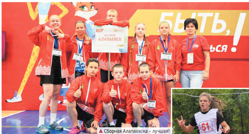
▲ Сборная Алапаевска - лучшая!