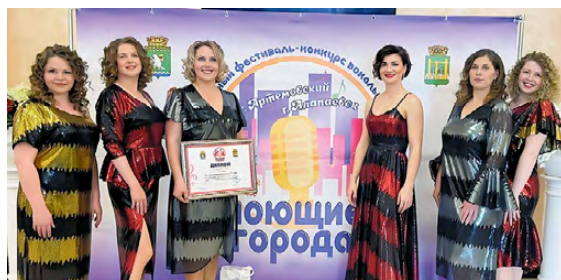
▲ Команда «GALA»