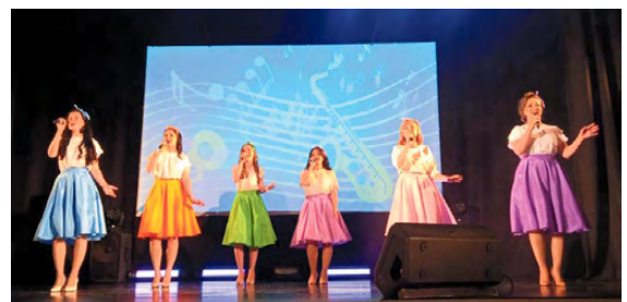
▲ Команда «Мелодия»