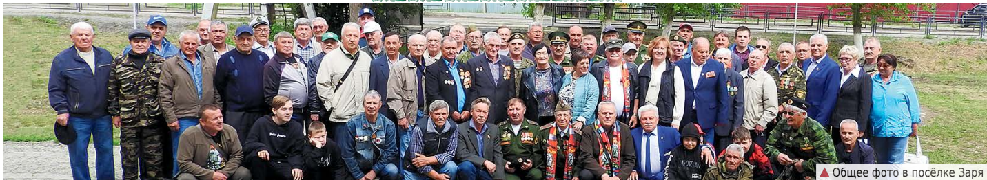
▲ Общее фото в посёлке Заря