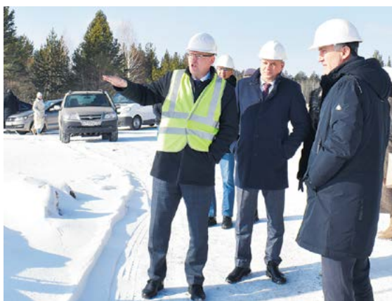
▲ На промплощадке...

Что касается образования металлургических шлаков, то, пройдя двойную переработку, они будут преобразовываться в определенную фракцию. После получения технических ус-