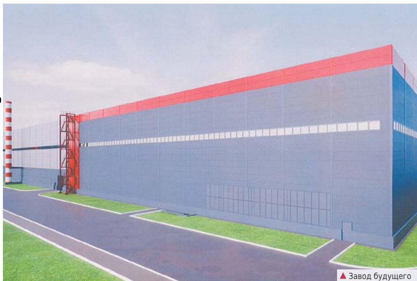
▲ Завод будущего

Крупнейший инвестор-застройщик «ФОРМАТ-ЕК», реализующий в Алапаевске масштабный проект по строительству нового металлургического завода, вошел в состав Алапаевского совета директоров. После ввода в эксплуатацию первой очереди инвестпроекта «Нейвасталь» станет крупнейшим на территории СНГ производителем стальных мелющих шаров.