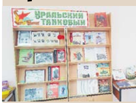
▲ Экспозиция выставки

Приглашаем гостей и жителей города Алапаевска посетить выставку, посвященную Уральскому добровольческому танковому корпусу , по адресу: г. Алапаевск, ул. Ленина, 15 (2 этаж).