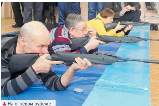
▲ На огневом рубеже

На днях в спортивном зале Алапаевского многопрофильного техникума прошли соревнования по пулевой стрельбе, посвященные Дню защитников Отечества и 80-летию Уральского добровольческого танкового корпуса.