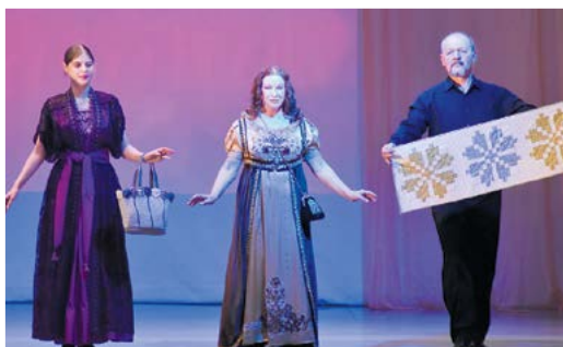
▲ Изделия мастериц демонстрируют актёры «Театрона»