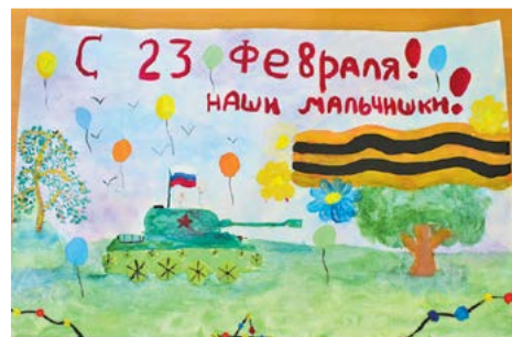
▲ Рисунок Ксении Баёвой

Прежде чем объявить имена победителей, редакция «Алапаевской газеты» выражает особую признательность всем, кто принял участие в конкурсе. В предыдущем номере газеты мы уже публиковали снимки некоторых работ, а сегодня продолжаем выполнять своё обещание.