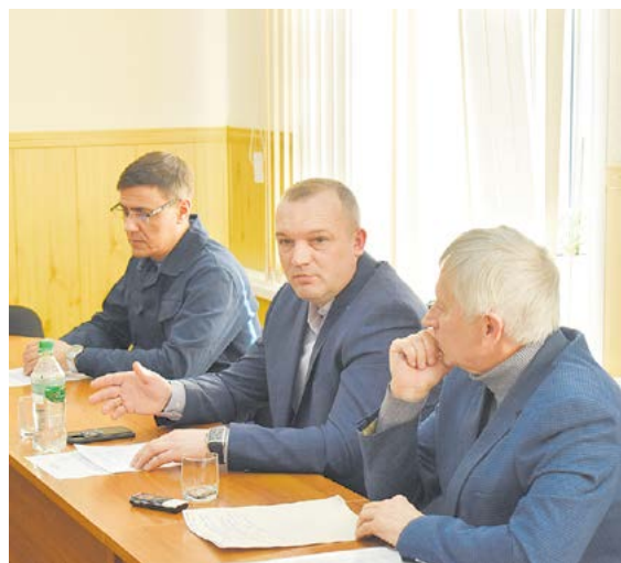
▲ На заседании совета директоров

производство, сортопркатное и электросталеплавильный передел с применением технологий и спецоборудования, не имеющих в России аналогов.