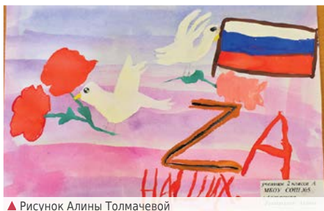
▲ Рисунок Алины Толмачевой