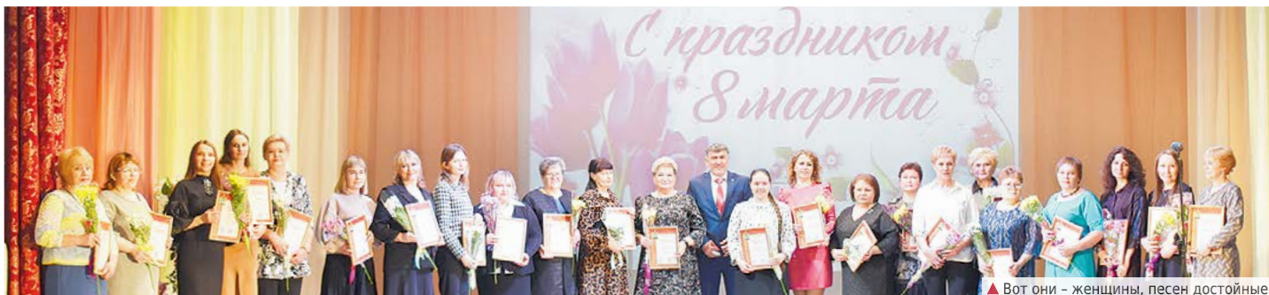
▲ Вот они – женщины, песен достойные