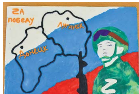
▲ Пластилинография Миланы Чепы