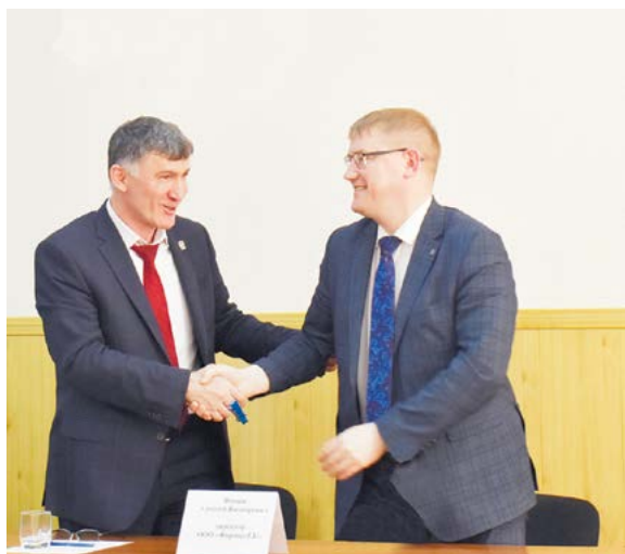
▲ Директор «ФОРМАТ-ЕК» с главой Алапаевска

Алапаевский металлургический комплекс будет представлен тремя большими подразделениями: шаропркатное