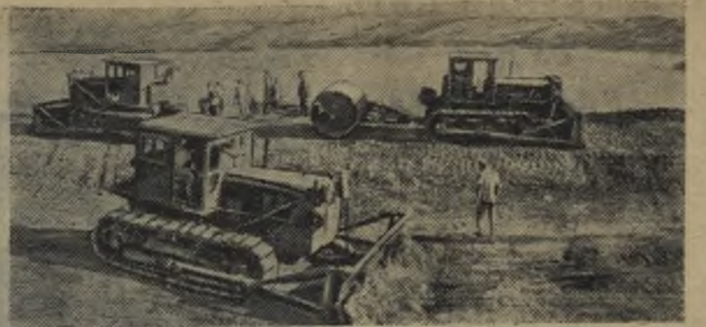
Ферганская область. Тысячи гектаров земель позволит оросить Керкидонское водохранилище. С окончанием строительства, которое завершится в нынешнем году, его чаша вместит двести миллионов кубометров воды.

На снимке: на строительстве водохранилища.