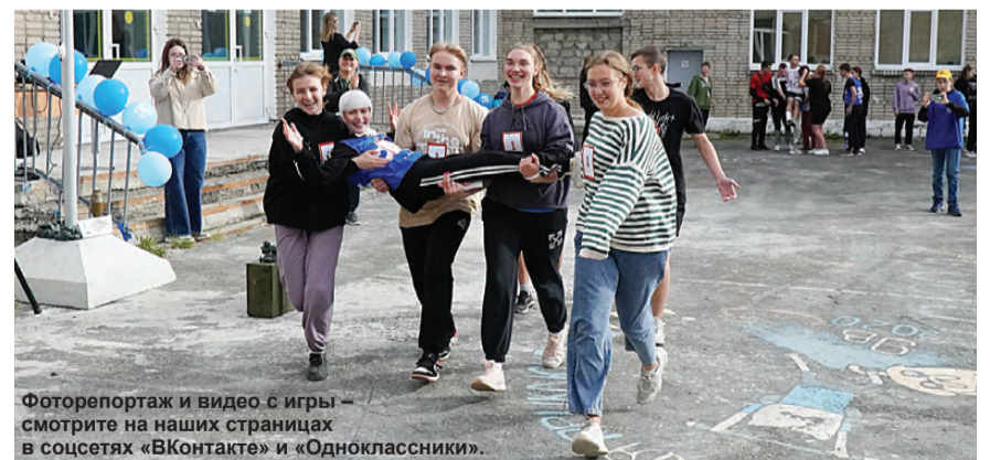
Фоторепортаж и видео с игры – смотрите на наших страницах в соцсетях «ВКонтакте» и «Одноклассники».

– Пусть ум и талант конструкторов, инженеров, руководителей производства и рабочих в цехах всегда кипит от интересных идей. Желаем успехов во всем. Спасибо предприятию-шефу, которое вместе с нами решает такие задачи, например, как подготовка школы к новому учебному году. Надеемся, что сотрудничество продолжится и дальше.