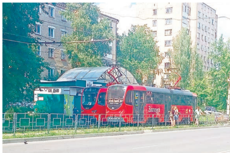
Вот на таком трамвайчике мы и отправились по Барнаулу