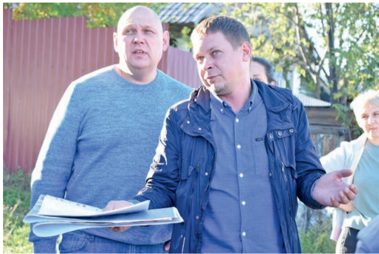
Представители УГХ и подрядчика смогли ответить только на те вопросы, в которых были компетентны

цы участка к дому уже будет тянуть каждый собственник самостоятельно.