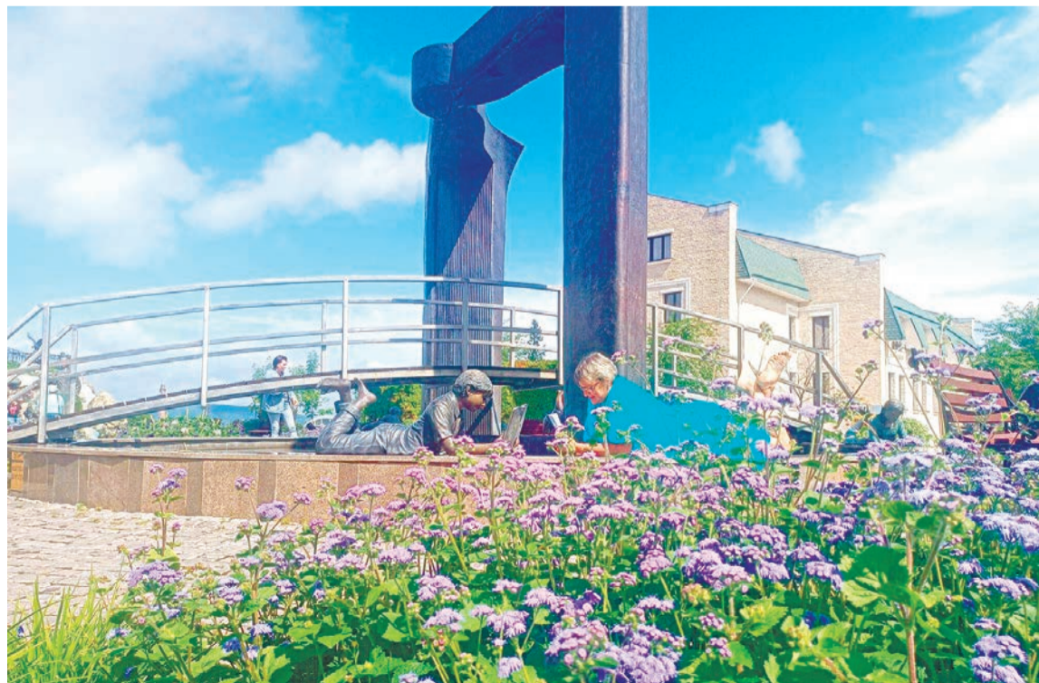
В столице Алтайского края есть почти такой же портал в будущее, как и в Качканаре

Даль бескрайняя видна! Не случайно рвалось сердце На Алтай у Шукшина.