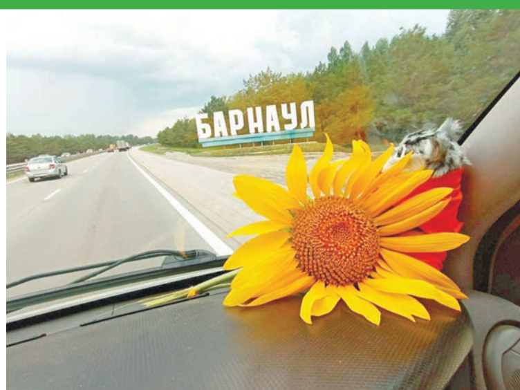
Барнаул ждёт теперь и тебя