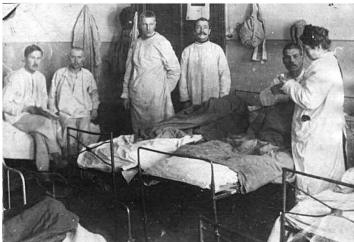
На территории Свердловской области во время войны насчитывалось более 150 эвакогоспиталей