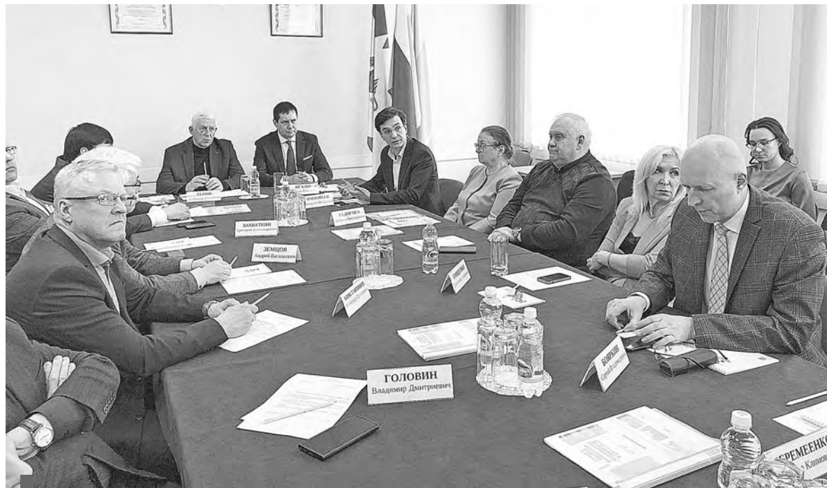
Заседание Совета директоров, апрель 2023 г.

Как только Президент РФ объявил о начале СВО, мы все силы направили на помощь военнослужащим и членам их семей. Решались и продолжают решаться вопросы по материально-техническому обеспечению бойцов (приобретение техники, оборудования и другого необходимого); по организации похорон погибших (предоставление автобусов, оплата поминальных