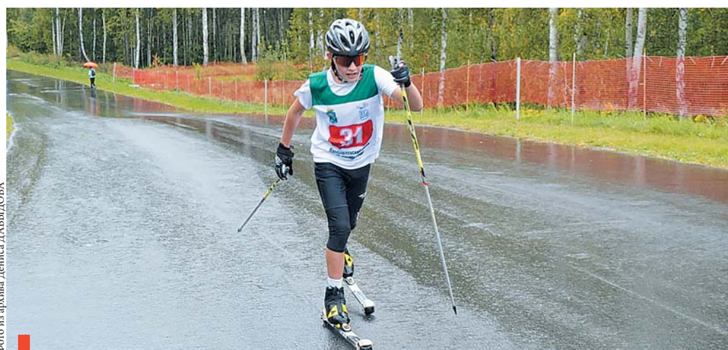
Тренировка на лыжероллерах в парке «Семейный» воспитанников секции лыжных гонок

– Секция бокса, самая молодая и перспективная, открылась в 2011 году. У нас занимаются 47 ребят. Принимаем с 7 лет, но перчатки юным боксерам надевать разрешено не ранее чем с 10-ти. С 12-ти они уже могут участвовать в соревнованиях.