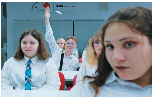
«Ура! Мы студенты!»