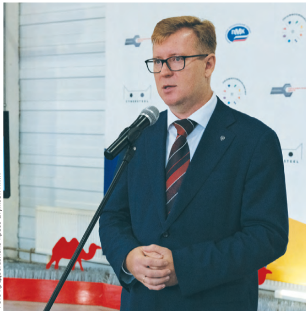
«Ребята, воплощайте свои идеи!»

В «Профессионалитете» участвуют две кузницы кадров – Первоуральский политехникум и Первоуральский металлургический колледж. ППТ включен в кластеры «Строительство» и «Туризм и сфера услуг». Предприятиями-партнерами являются некоммерческое партнерство «Управление строительства «Атомстройкомплекс», АО «ДИНУР», НКО «Ассоциация кулинаров и рестораторов Свердловской области» соответственно. Что же касается ПМК, то образовательная организация сама является ядром кластера в отрасли металлургии. Собственно, прообразом новой модели СПО стала образовательная программа «Будущее Белой металлургии», реализуемая в колледже.