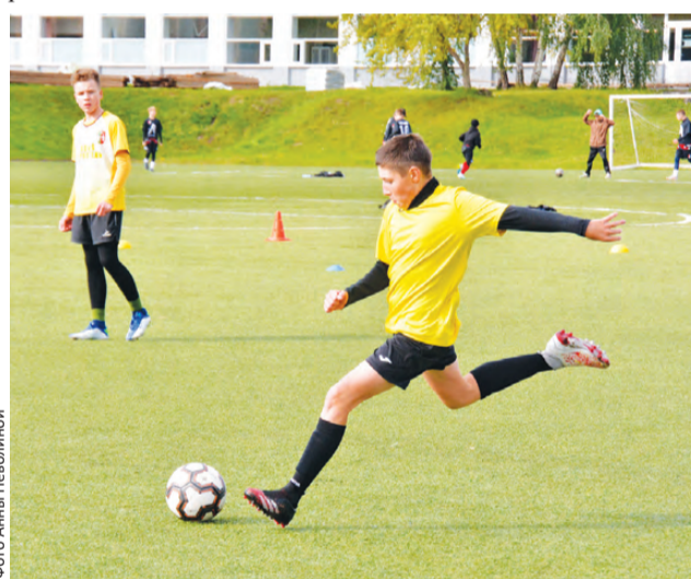
Спорт – отличная школа здорового досуга!