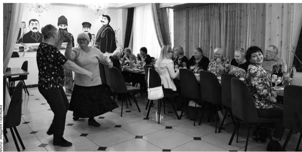
«Юбиляры» пустились в пляс