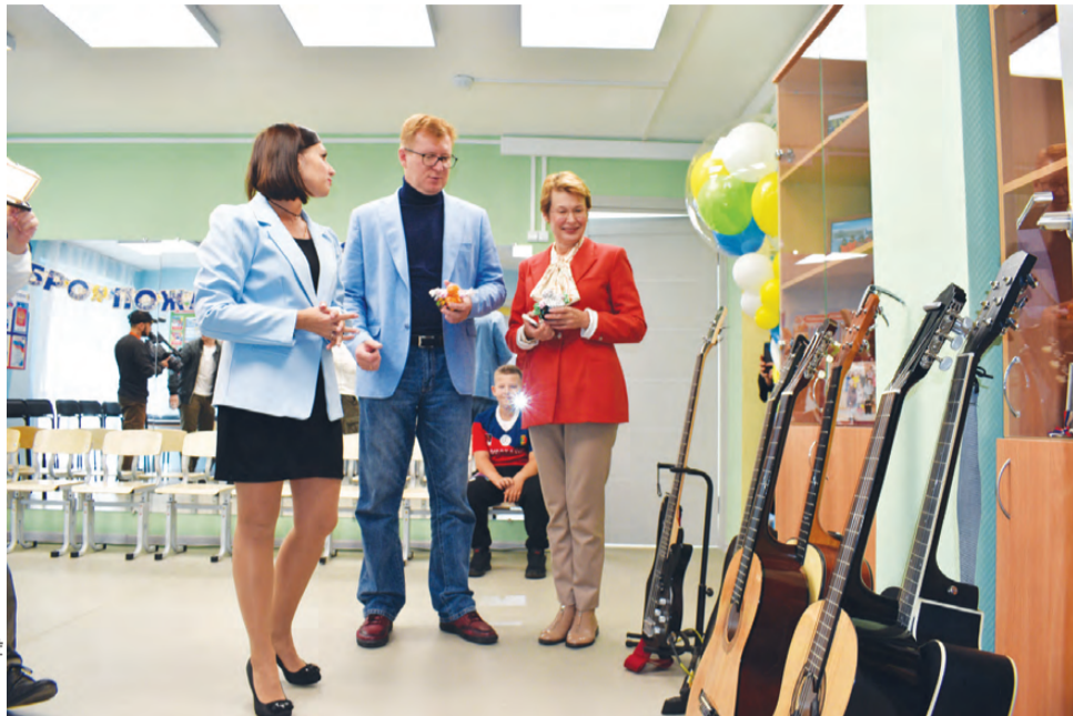
Клуб отремонтировали, оборудование – закупили

Вчера после капитального ремонта открылся клуб по месту жительства «Кристалл», что на улице Советская.