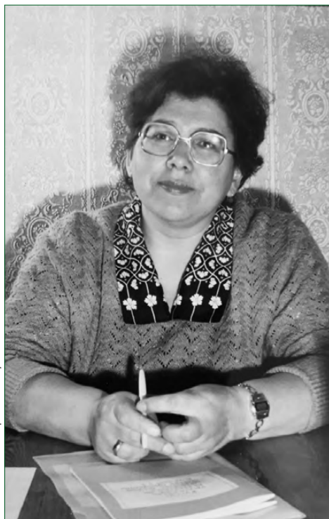
Ольга Ильинична с детства представляла себя только учителем