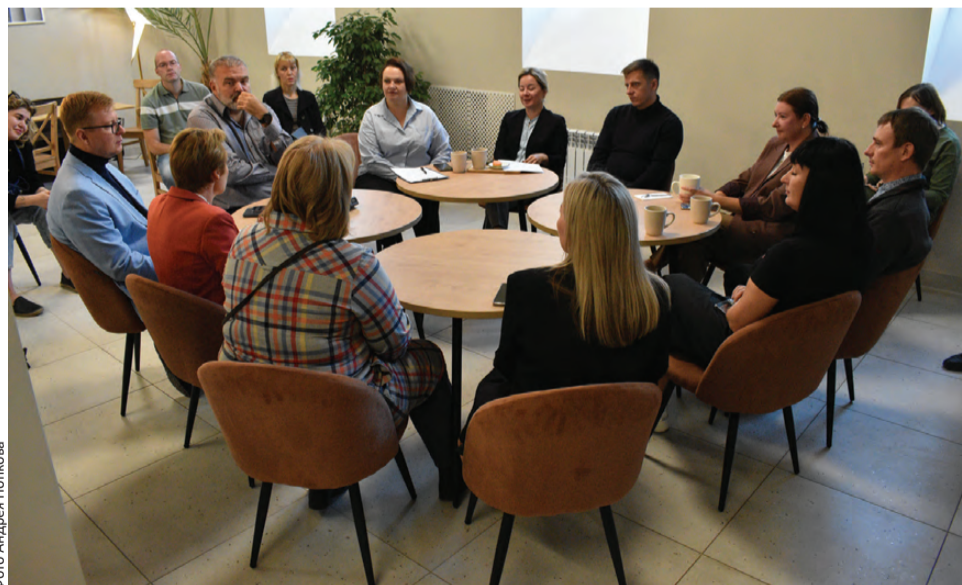
Создаем образ Первоуральска-туристического сообщества

Амбициозная задача. И вполне достижимая. Так, на «Бизнес-завтрак» пригласили победителей конкурсного отбора на поддержку реализации общественных инициатив, направленных на развитие туристической инфраструктуры, поддержку общественных инициатив на создание модуль-