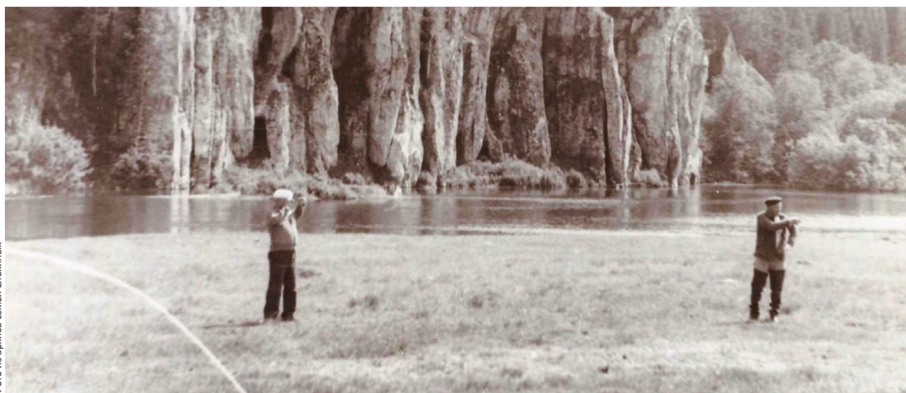
Вид на Шайтан-камень. 80-е годы

цензурными словами, чем самым прекратил читку в читальне и даже работу в сельсовете. На улицах села в ночное время распеваются нецензурные песни». В том же акте указано, что в ночь с 28 на 29 октября у гражданки Нижнего села со двора похищена овца, а 20 октября при выезде избача в Билимбае на совещание вскрыт и снят замок в клубе.