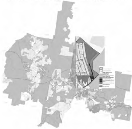
Рисунок 1. Схема размещения территории проектирования в структуре поселения

Участок проектирования имеет многоугольную форму и занимает площадь 22,3 га. В настоящее время на территории имеются объекты инженерной инфраструктуры (трансформаторная подстанция, газопровод, линии электропередачи, линия связи), асфальтовые и грунтовые дороги и зеленые насаждения.