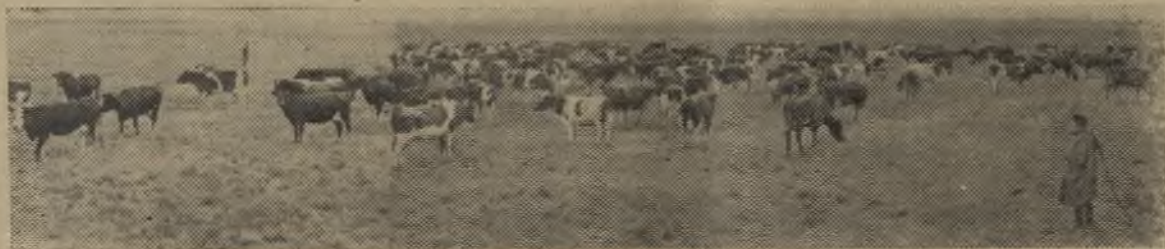
В совхозе имени Тельмана Ленинградской области созданы долголетние культурные пастбища. С 1 гектара здесь получают по 3,5 тысячи кормовых единиц.