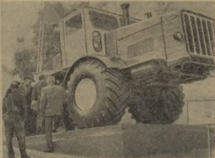
МОСКВА. Тысячи москвичей и гостей столицы побывали в многочисленных павильонах Международной выставки «Современные сельскохозяйственные машины и оборудование».

На снимке: колесный трактор «Кировец», предназначенный для выполнения различных сельскохозяйственных и транспортных работ на повышенных скоростях. Мощность трактора 210 — 220 лошадиных сил, тяговое усилие — 6000 килограммов.