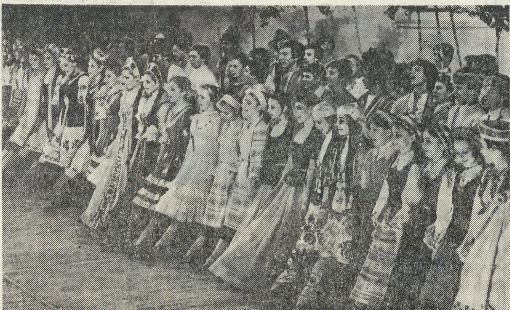
степул во многих странах мира.