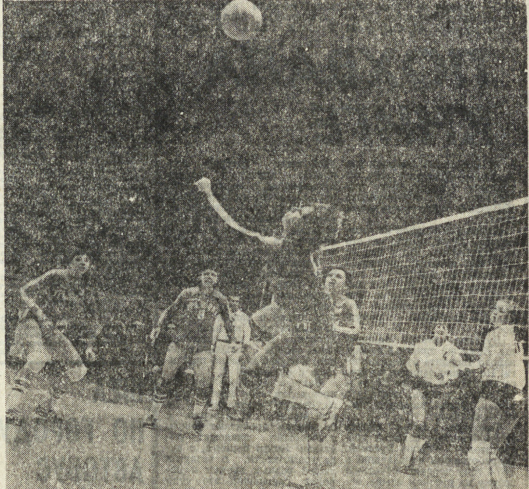
В Свердловском Дворце спорта профсоюз провёл пятый тур женского чемпионата страны по волейболу среди команд высшей лиги.