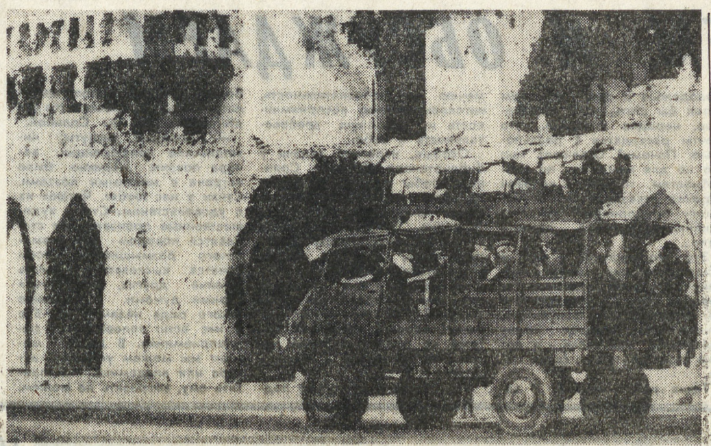
По сообщению информационных агентств в Найамени, обстановка в Чаде остается напряженной вследствие продолжающейся оккупации этой африканской страны, ее фактического раскола на две части. На юге и в центре Чада, где занимают позиции ин-