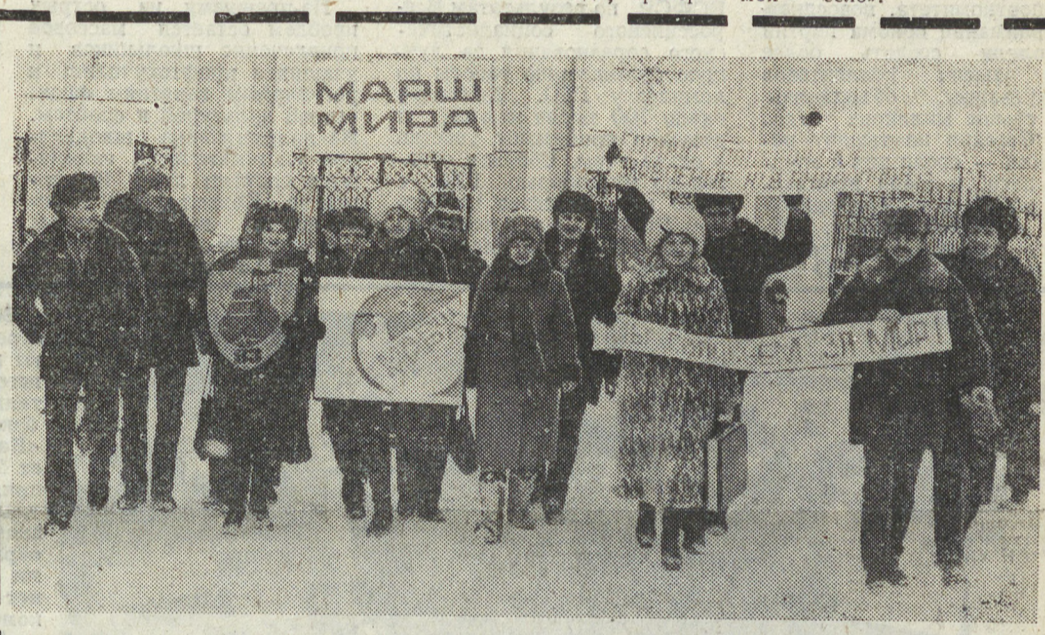
МАРШ МИРА СОВЕТСКОЙ МОЛОДЕЖИ