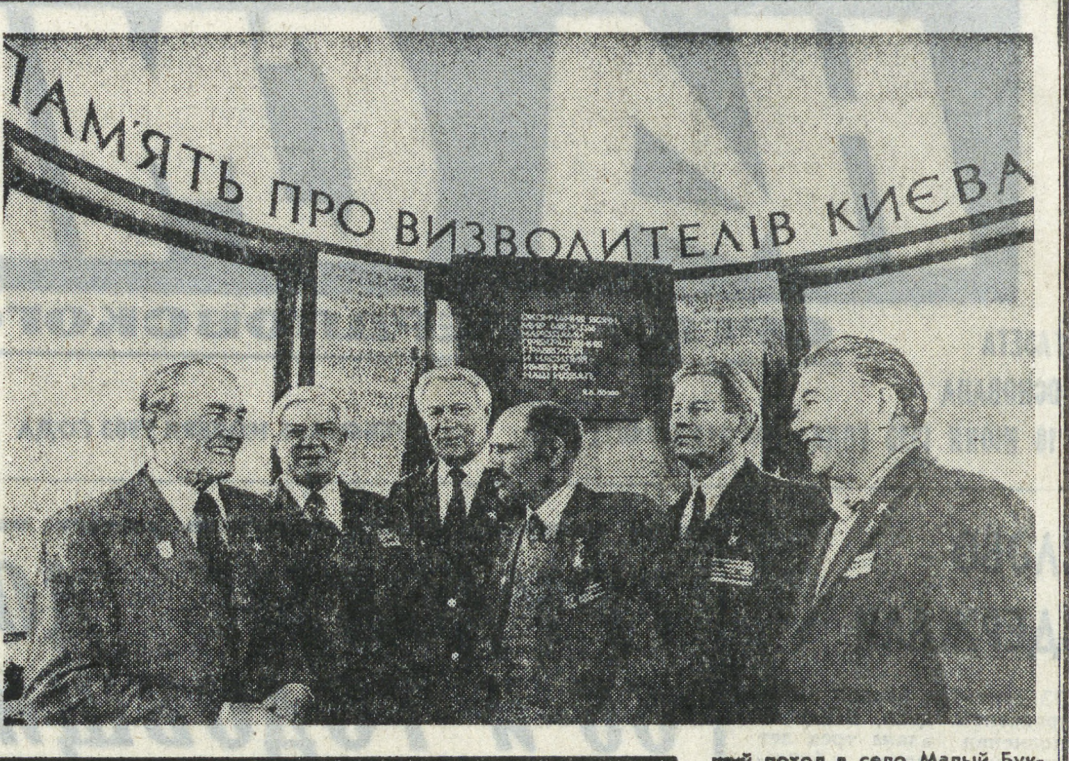
ЗАВТРА — 40 ЛЕТ ОСВОБОЖДЕНИЯ КИЕВА

Дошла к Днепру. 23-я гвардейская мотострелковая бригада, продвигая стремительные броски, на рассвете 22 сентября форсировала Днепр и захватила плацдарм в районе Великий Букири.