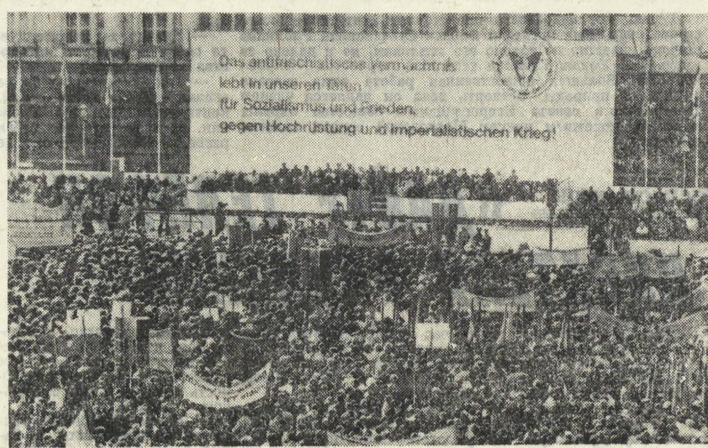
ГДР. «Заветы антифашистов живут в наших делах». «За мир и социализм», «Против империалистического курса на конфронтацию и гонку вооружений!» — под такими лозунгами в Берлине прошла манифестация...

«Все народы, каждый житель нашей планеты должны осознать грозящую опасность. Осознать, чтобы объединить свои усилия в борьбе за собственное существование».