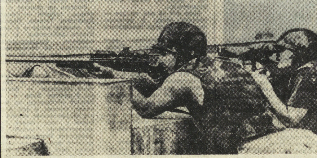
НА СНИМКЕ: американские морские пехотинцы ведут огонь в районе беirutского международного аэропорта.