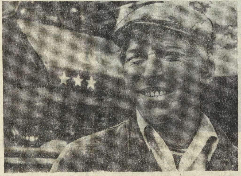
Каменский район.