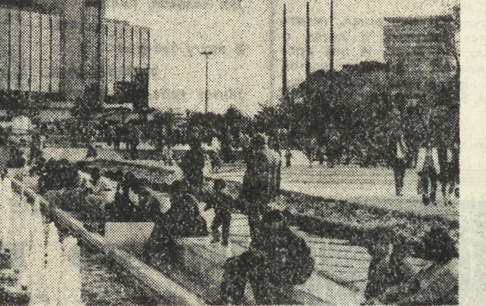
НА СНИМКЕ: север перед народным Дворцом культуры «София» в центре столицы.