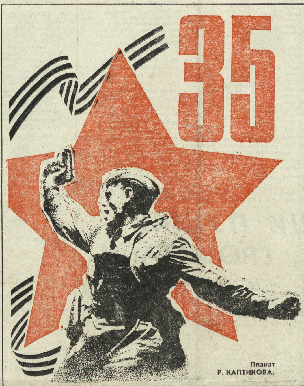
Плакат Р. КАПИТКОВА.