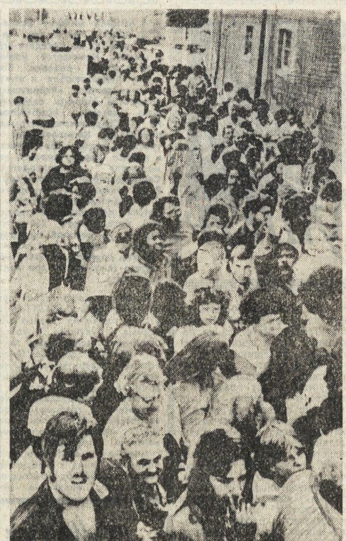
Национальной проблемой в США стало стремительное увеличение числа голодающих американцев.

Сейчас Белый дом откровенно пытается транжирить деньги, заявила на пресс-конференции Б. Хонеггер. Однако никому не удастся опровергнуть содержание моих выступлений с критикой незаконной дискриминации американских женщин. (ТАСС).