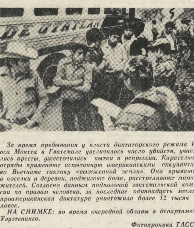
За время пребывания у власти диктаторского режима Ривоса Монта в Гватемале увеличилось число убийств, участились аресты, жестоки были пытки и репрессии. Карателями отрядами применяют испытанную американскими оккупантами во Вьетнаме тактику «оживленной земли». Они арванают в поселки и деревни, поджигают дома, расстреливают мирных жителей. Согласно данным подпольной гватемальской комиссии по правам человека, за последние одиннадцать месяцев проамериканская диктатура уничтожила более 12 тысяч человек.

Шпионская практика полиции вызвала негодование общественности. При поддержке нескольких общественных организаций американский союз защиты гражданских свобод возбудил судебный иск и потребовал, чтобы секретные досье были обнародованы, а инициаторы слезки наказаны. Власть Лос-Анджелеса наняла адвоката, пытаясь выиграть процесс и таким образом уязвить шпionaж за гражданами.