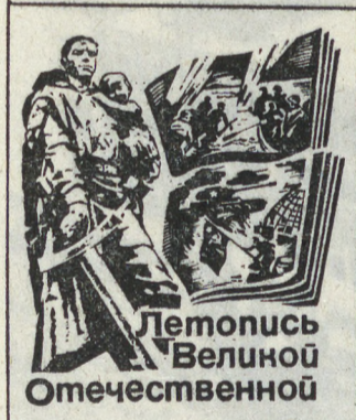
Летопись Великой Отечественной

С ЭТИМ удивительным человеком я познакомился во время встречи школьников с ветеранами Великой Отечественной войны. На его груди блестящие ордена и медали. На левом плечике горела звезда — почетный знак ветерана — панфиловца.