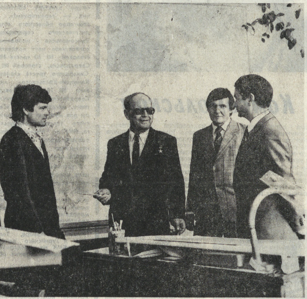
ХАБАРОВСК. Коллектив научно-исследовательского института тектоники и геофизики Дальневосточного научного центра (ДВНЦ) СССР закончил работу и издал тектоническую карту Дальнего Востока. Она стала основным координационным инструментом научно-исследовательских и производственных организаций для разрабатывания разнообразных поисковых работ на минеральные ресурсы, в том числе нефтегазовых месторождений.