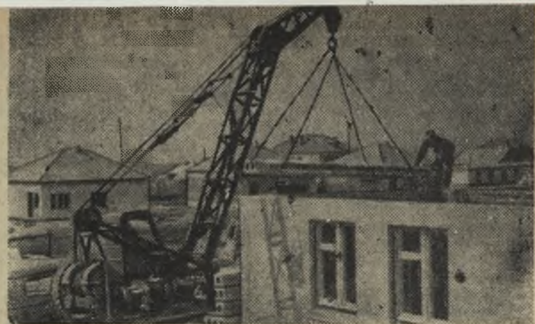
Полтавская область. Правление колхоза имени Шевченко Карловского района решило в нынешнем году построить в кредит для колхозников более 20 благоустроенных домов.

По спортивно-массовой работе планируется смотр площадок и пионерских лагерей на лучшую организацию работы по обучению детей плаванию, легкоатлетические соревнования, первенство уличных футбольных команд на приз имени Павлика Морозова, участие в слете туристов «Здравствуй, лето!», а в сентябре, как итог всей работы, — слет «Золотая осень».