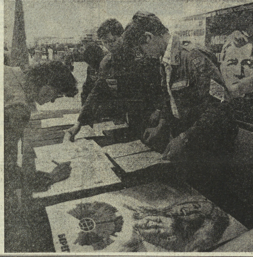
Меня зовут Валентиной

В отряд космонавтов был зачислен в 1978 году. Прошел полный курс подготовки по программе пилотируемого корабля «Союз-Т» и орбитальной станции «Салют».