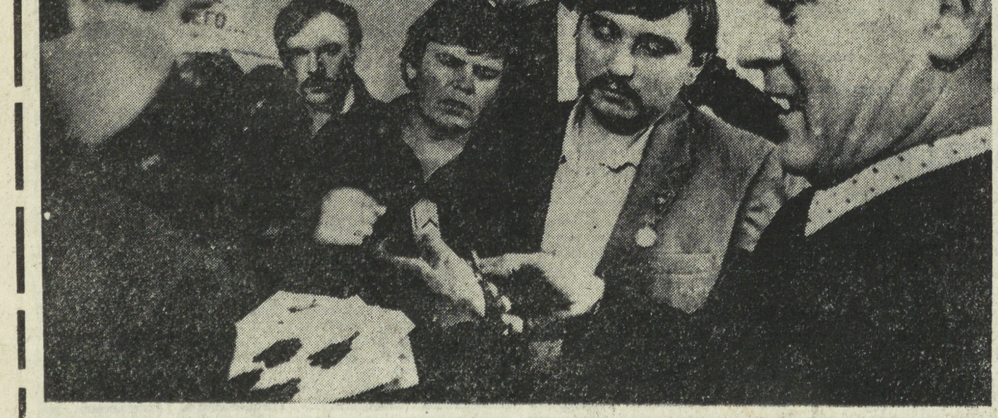
НА СНИМКЕ: лауреат Го