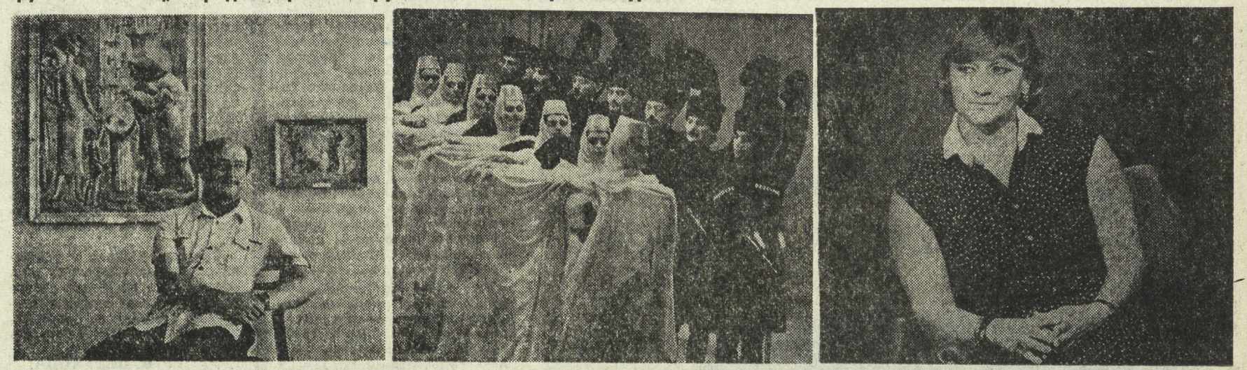
На снимках: народный художник Грузинской ССР Зураб Нижарадзе на открытии выставки в Свердловске; национальный грузинский танец; народная артистка Грузинской ССР Софики Чаураели.

«Спортивный городок сооружен участниками Всесоюзного слета молодых перелетчиков производства, посвященного 50-летию Ураламашзавода. 26 июня 1983 года». Такие мемориальные доски останутся в память об этом теплом солнечном дне, когда посланцы из всех уголков нашей страны дружно работали на строительстве спортивных площадок Ураламаша.