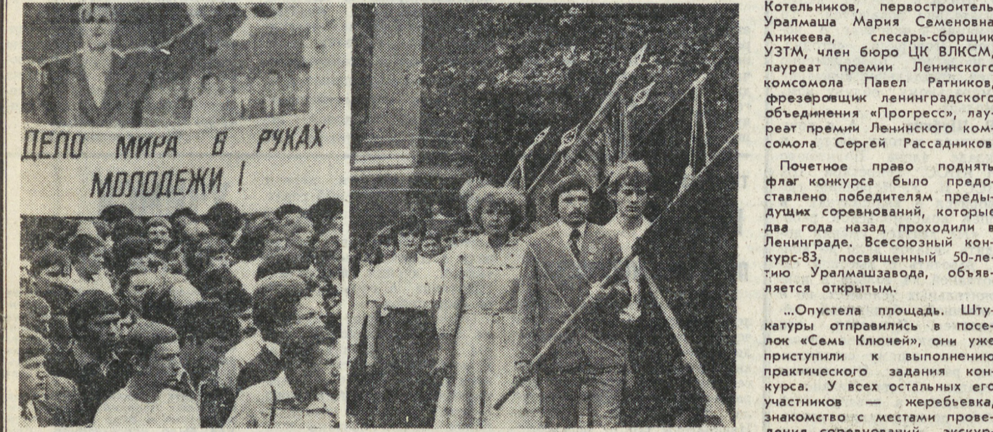
50 ЛЕТ УЗТМ

песни и танца Грузии «Аджария» и группа кинематографистов выехали в Нижний Тагил, государственной ансамбль песни и танца Грузии «Рустави» выступил перед жителями производственного объединения «Уралмаш».